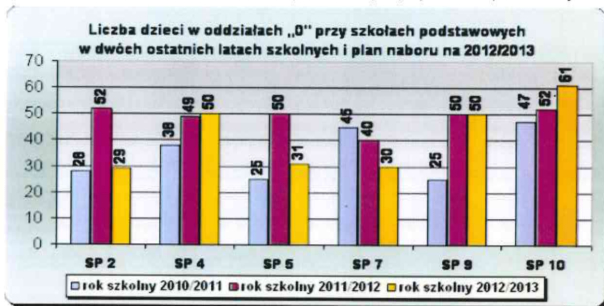
Wykres Nr 2 Liczba uczniów w oddziałach przedszkolnych przy szkołach podstawowych.

* nabór na rok 2012/2013 w trakcie realizacji