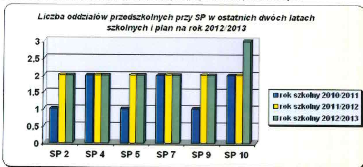
Wykres Nr 3 Liczba oddziałów przedszkolnych przy szkołach podstawowych.

* nabór na rok 2012/2013 w trakcie realizacji