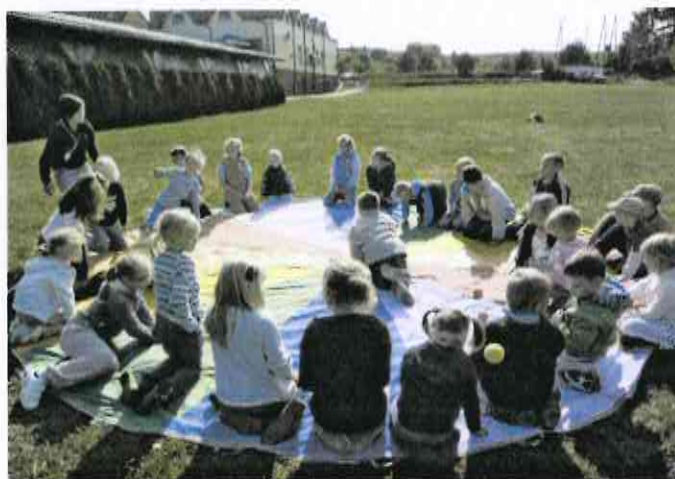
Zajęcia dla dzieci podczas warsztatów z komunikacji w rodzinie.

Ponadto 100 osób (w tym dzieci) wzięło udział w Warsztatach wyjazdowych z komunikacji w rodzinie.