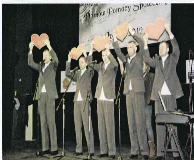
Przełąd Piosenki Religijnej Domów Pomocy Społecznej - Łomża 2012

„Integracyjny Turniej Sportowy – Zdrowo i Wesolo” był formą pomocy w zapewnieniu godziwych warunków zdrowotnych i kulturalnych osobom niepełnosprawnym intelektualnie poprzez upowszechnianie kultury fizycznej i sportu oraz promocję zdrowego stylu życia. Propagowanie różnych form sportu dostosowanego do możliwości osób niepełnosprawnych pozwoliło na podnoszenie ich sprawności fizycznej i psychomotorycznej, jak również na aktywizację środowiska niepełnosprawnych. Organizacja imprezy sportowej,