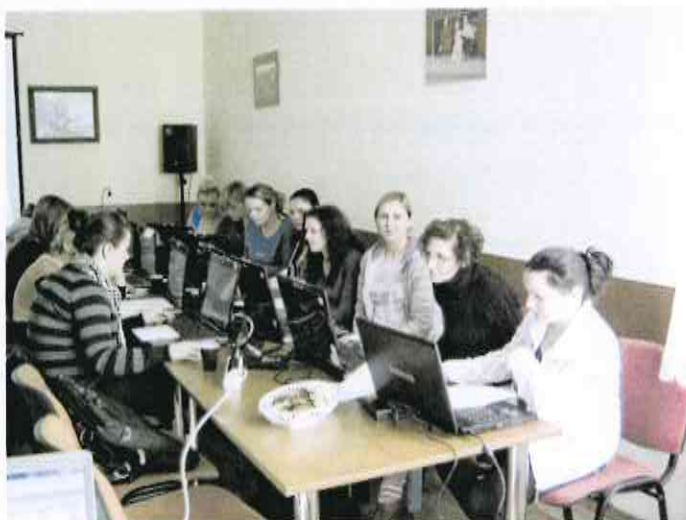
Szkolenie zawodowe-obsługa kasy fiskalnej.

Ponadto 100 osób (w tym dzieci) wzięło udział w Warsztatach wyjazdowych z komunikacji w rodzinie.