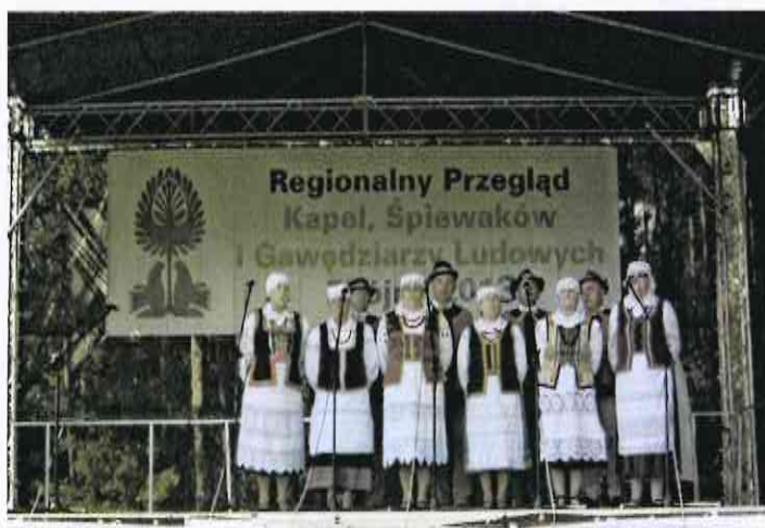
Występ Zespołu z Klubu Seniora na Regionalnym przeglądzie kapel ludowych