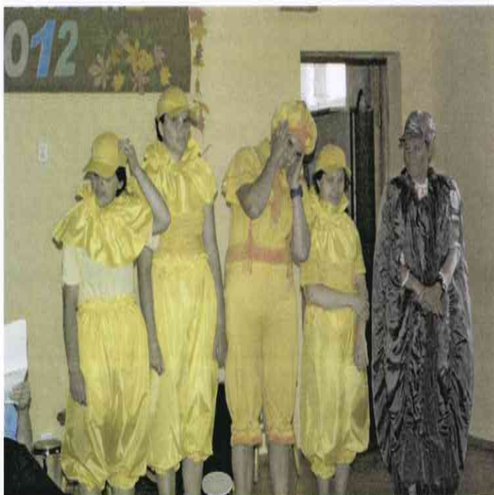
Spotkania Wrześniowe 2012