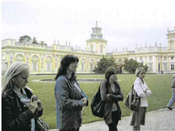
Uczestnicy projektu –wycieczka do Palacu w Wilanowie w Warszawie.

Dla uczestników projektu „EFS- Nowa droga do sukcesu” dla 116 osób przyznane zostały zasiłki celowe na kwotę 65 105 zł. Dla 39 dzieci uczestników zostało opłacone przedszkole na czas realizacji projektu oraz dla dwóch uczestniczek opłacano chesne za naukę w szkole ponadgimnazjalnej.