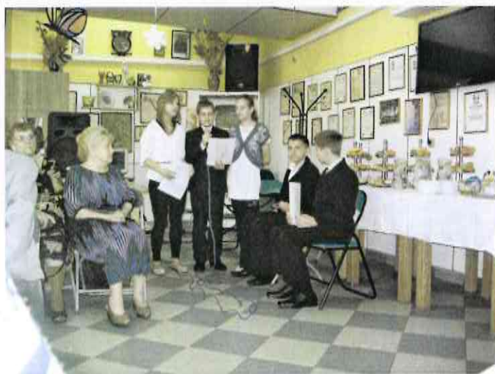
Program religijno patriotyczny w Klubie Seniora- Teatr Żywego Słowa „Logos”.

Klub Seniora działa za zasadach „ dziennego pobytu ”. Posiada 120 miejsc dla seniorów, z których korzystało 160 osób. Wydano 28 429 posiłków (370 posiłków miesięcznie). Prowadzona była również działalność kulturalno – oświatowa. Klub Seniora działa w godzinach od 7.00 do 17.00. W ramach tej działalności Seniorzy mogą rozwijać swoje zainteresowania, uczestniczyć w różnych formach terapii zajęciowej mającej na celu utrzymanie sprawności fizycznej i umysłowej.