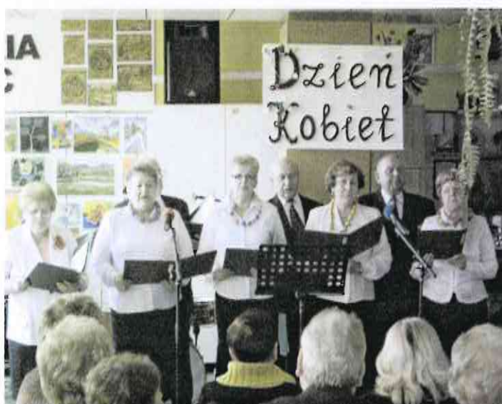
Obchody Dnia kobiet w Klubie Seniora

Podopieczni Klubu Seniora uczestniczyli w codziennych zajęciach komputerowych, plastycznych i teatralnych, w nauce tańca. W drugą i czwartą sobotę m-ca organizowane były dla Seniorów zabawy taneczne.