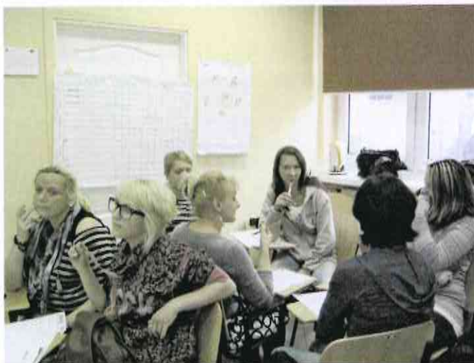
Uczestnicy podczas warsztatów zarządzania budżetem.