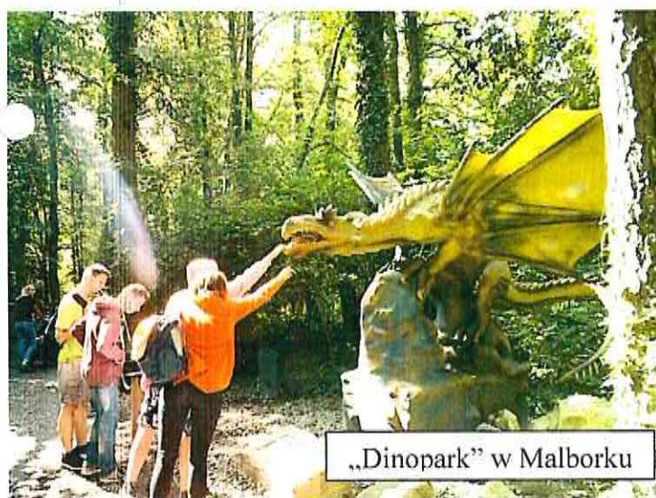
„Dinopark” w Malborku