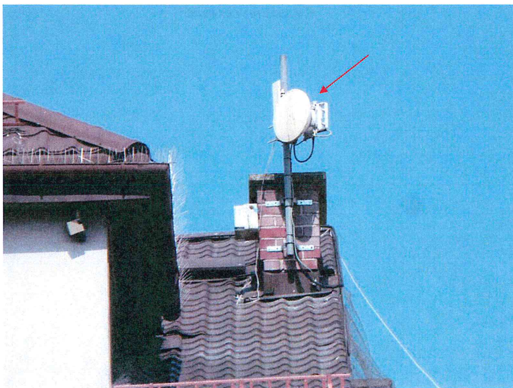
Widok instalacji radiokomunikacyjnej Stacja Netia LOMZB062 - LOMZM00060 Łomża, Aleja Legionów 40.