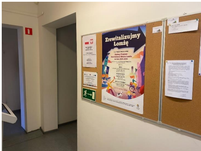
Fot 2. Plakaty informujące o konsultacjach społecznych projektu GPR oraz ogłoszenie w prasie lokalnej.