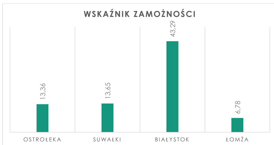
Wykres 1. Wskaźnik zamożności w wybranych miastach w roku 2012.