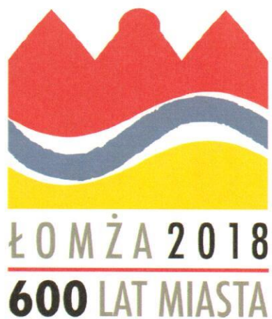
2.3. Wersja pionowa skrócona