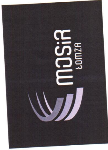
MOSiR ŁOMŻA logotyp wersja czarno-biała w kontrze