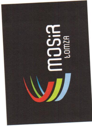
MOSiR ŁOMŻA logotyp wersja czarno-biała w kontrze