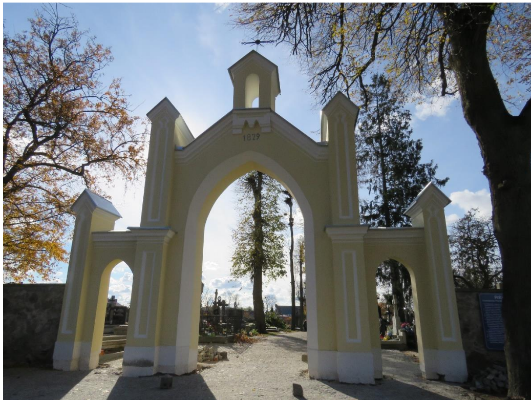
Brama cmentarza wielowyznaniowego przy ulicy Kopernika, 1829 r.