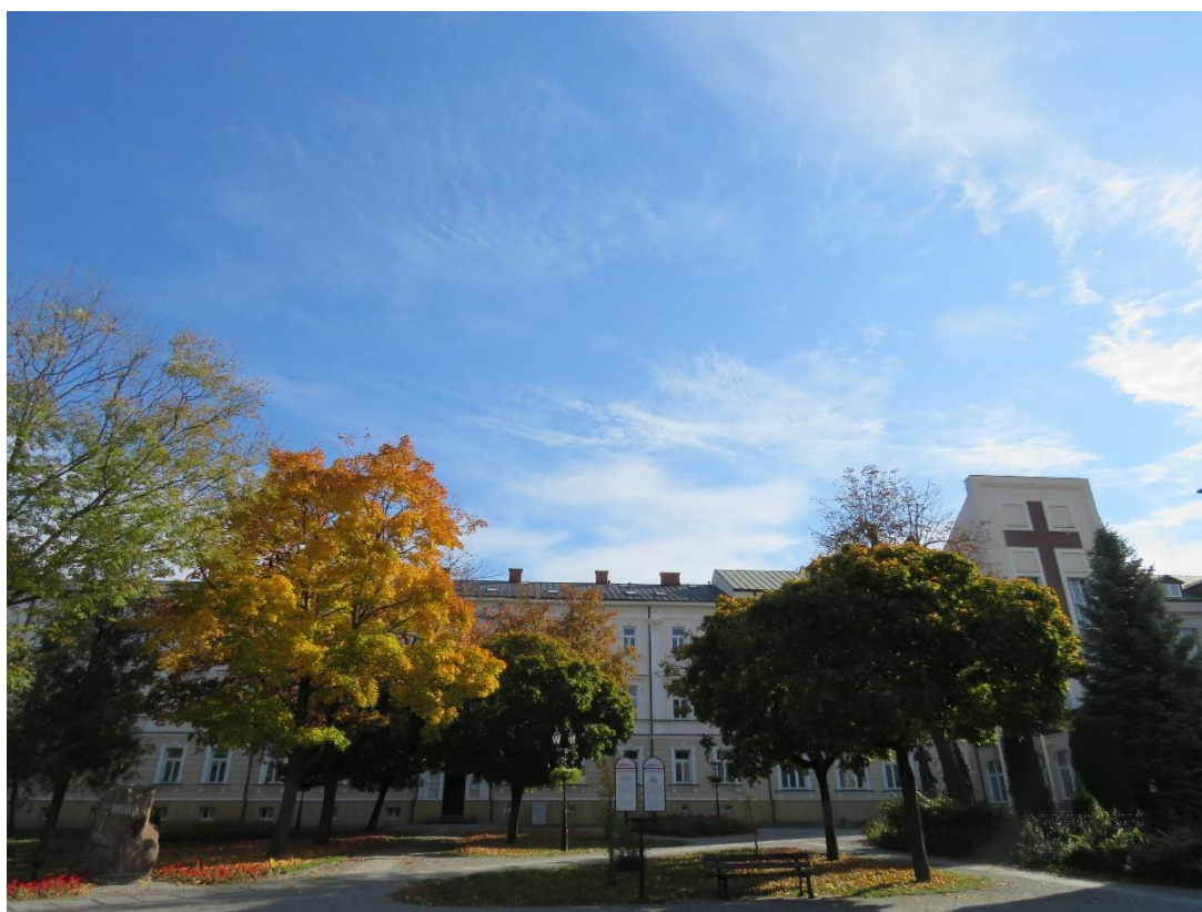
Pałac Gubernatora, ob. Wyższe Seminarium Duchowne, Plac Papieża Jana Pawła II, 1845 r.