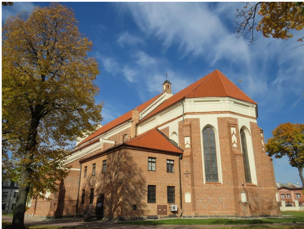
Kościół katedralny pw. św. Michała Archanioła i Jana Chrzciciela, ul. Dworna, 1525 r.

Brak jest bezpośrednich źródeł do rekonstrukcji szczegółowego obrazu rozplanowania i zabudowy Łomży w czasach Księstwa Mazowieckiego. Informacje na ten temat są też ograniczone dla kolejnych stuleci. W XV w. zabudowa miejska koncentrowała się wokół Starego Rynku, z którego wybiegały dwie główne ulice: Dworna i Senatorska. Na rynku znajdował się murowany ratusz oraz studnia, a pierzeje rynku były zabudowane murowanymi kamienicami. Kamienice stały też przy ulicy Dwornej i Senatorskiej. W tym czasie w Łomży istniało kilka kościołów i kaplic oraz dwa szpitale, w tym szpital Św. Ducha. Przed 1504 r. z fundacji księżęcej rozpoczęto budowę gotyckiego kościoła pw. św. Michała, ukończoną w 1525 r.