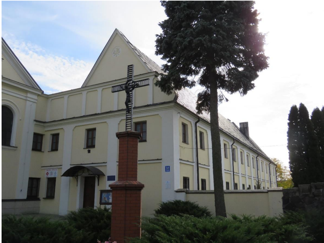
Klasztor benedyktynek, ul. Dworna, 1760-1764 r.