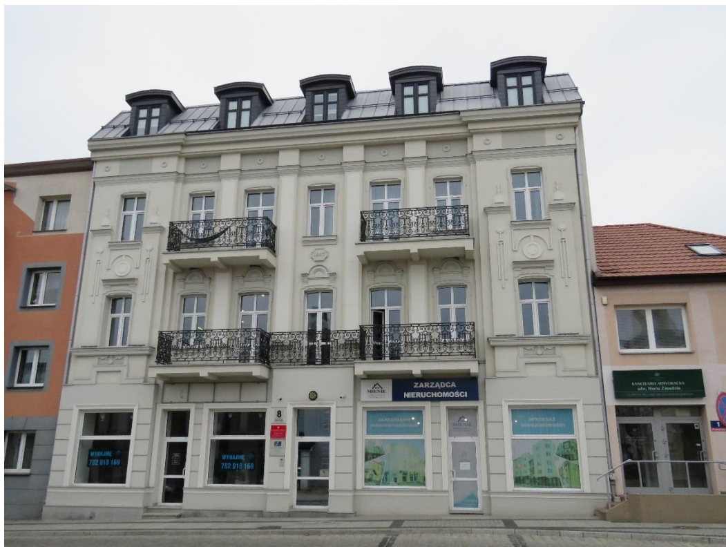
Kamienica, Stary Rynek, 4. ćwierć XIX w.