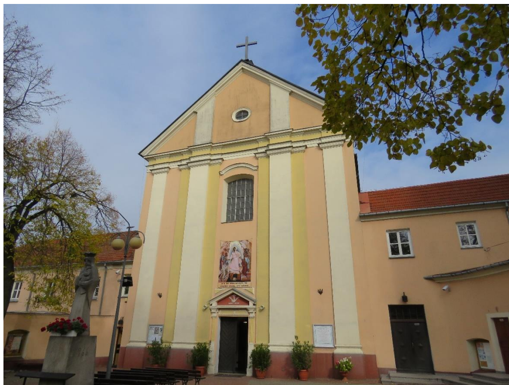
Fasada kościoła w zespole klasztoru o. Kapucynów, ul. Krzywe Koło, 1770-1772 r.

W 1807 r., na mocy traktatu pokojowego w Tylży, Łomża wraz ze wschodnim Mazowszem weszła na osiem lat w skład Księstwa Warszawskiego, stając się stolicą departamentu i jedną z baz wojskowych w wojnach napoleońskich. Klęska Napoleona Bonaparte w 1815 r. spowodowała podporządkowanie