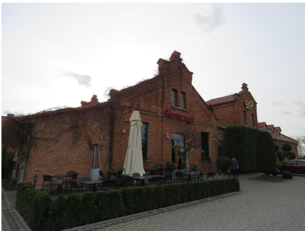
Hala główna w zespole rzeźni miejskiej, ul. Nowogrodzka, 1906 r.

Rozwijał się drobny przemysł. Jeszcze w 1860 r. powstała rafineria cukru, później zaś tartaki, dwa browary i dwie garbarnie, na początku wieku wzniesiono rzeźnię miejską. Od końca XIX w. Łomża stała się miastem garnizonowym. W latach 1887-1897 wokół miasta wzniesiono pięć fortów Twierdzy Łomża osłaniającej nadgraniczne tereny Cesarstwa Rosyjskiego od strony Prus Wschodnich. Fortyfikacje te nie spełniły swojej funkcji w czasie I wojny światowej, natomiast odegrały znaczącą rolę w 1920 r. podczas wojny polsko-bolszewickiej. Służyły też jako miejsce oporu wojsk polskich we wrześniu 1939 r.