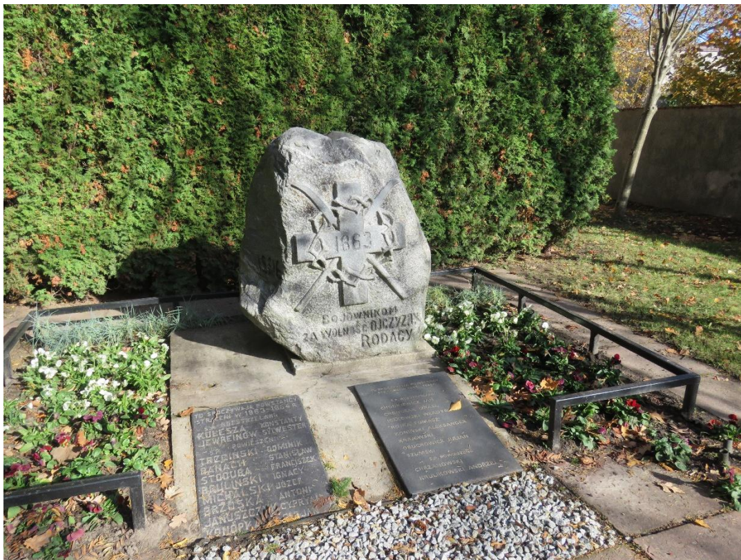
Cmentarz powstańców 1863 r., Szosa Zambrowska

Stopniowy rozwój miasta przerywany był wybuchami powstań narodowych: listopadowego i styczniowego, w których mieszkańcy Łomży brali czynny udział. Tragicznym epizodem powstania styczniowego było wymordowanie w 1863 r. przez kozaków pięćdziesięciu uczniów, którzy utworzyli oddział i podjęli próbę dołączenia do powstańców.