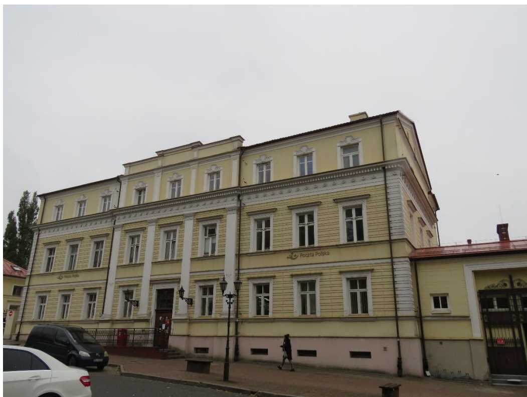
Budynek poczty, Plac Pocztowy, 1843-1844 r.