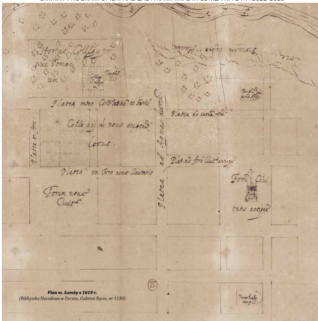
Stary i Nowy Rynek na planie Łomży z 1619 r. (za: Łomża w dokumencie archiwalnym)

Okres pomyślnego rozwoju Łomży trwał do pierwszej połowy XVII w. Upadek miasta przyniosły wojny szwedzkie i związane z nimi pożary oraz epidemie. Liczba ludności spadła wówczas do zaledwie 300 osób (w 1676 r.). Miasto płonęło w: 1696 i 1751 r. Zarazy odnotowano w latach: 1700, 1711, 1791 i 1800. Nastąpił upadek rzemiosł.