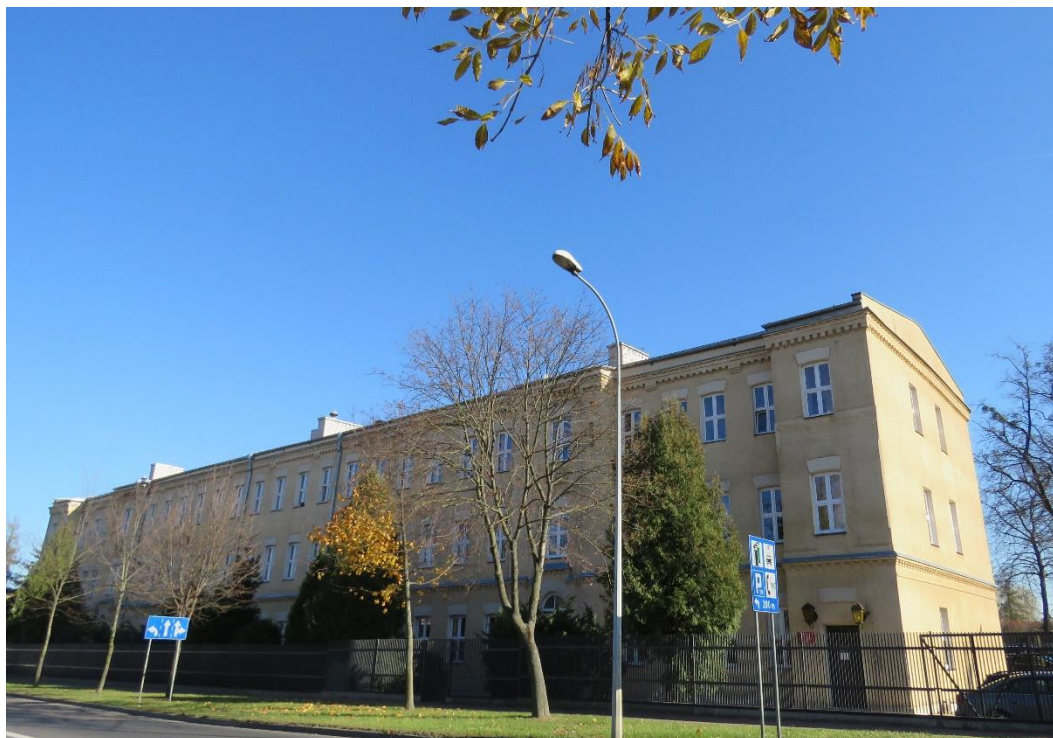
Budynek koszarowy, ul. Wojska Polskiego, 1899-1900 r.

W czasie II wojny światowej Łomża została zniszczona w 70%, głównie w wyniku walk prowadzonych w pierwszej połowie września 1944 r. Wcześniej, podczas okupacji niemieckiej w latach 1942-1944 hitlerowcy wymordowali ok. 7000 mieszkańców Łomży pochodzenia żydowskiego. Piętnastego lipca 1943 r. w Jeziorku dokonali mordu na 63 przedstawicielach inteligencji łomżyńskiej.