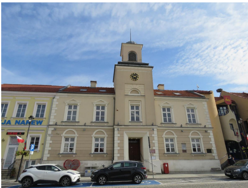
Budynek ratusza, Stary Rynek, 1822-1824 r.

Na lata 20. XIX w. przypadł stopniowy wzrost zaludnienia miast. W 1820 r. miało ono 2673, a w 1825 r. ok. 3300 mieszkańców. W 1820 r. zabudowa składała się z 251 domów. Rozwojowi handlu i budowie nowych domów sprzyjało osiedlanie się ludności żydowskiej. W połowie lat 20. XIX w. podjęto próbę rozwinięcia w Łomży przemysłu włókienniczego. W tym celu w 1826 r. zbudowano folusz i sześć domów dla tkaczy. Zamierzenie to zniweczył wybuch powstania listopadowego. Od końca pierwszej połowy lat 20. XIX w. prowadzona była regulacja zabudowy miasta. W 1824 r. wzniesiono nowy ratusz jednocześnie rozbierając stary. Przedłużono ul. Senatorską, co spowodowało konieczność zburzenia istniejącej jeszcze części gotyckiego zamku. Około 1840 r. pierzeje Nowego Rynku zabudowano murowanymi, jednopiętrowymi kamienicami. Obok wytyczono Plac Pocztowy i wzniesiono budynek poczty.