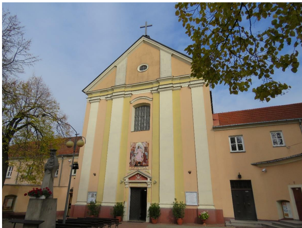
Fasada kościoła w zespole klasztoru o. Kapucynów, ul. Krzywe Koło, 1770-1772 r.

W 1807 r., na mocy traktatu pokojowego w Tylży, Łomża wraz ze wschodnim Mazowszem weszła na osiem lat w skład Księstwa Warszawskiego, stając się stolicą departamentu i jedną z baz wojskowych w wojnach napoleońskich. Klęska Napoleona Bonaparte w 1815 r. spowodowała podporządkowanie