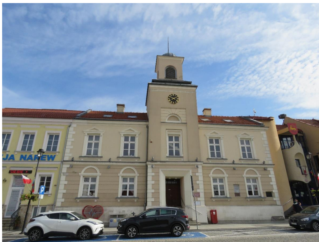
Budynek ratusza, Stary Rynek, 1822-1824 r.

Na lata 20. XIX w. przypadł stopniowy wzrost zaludnienia miast. W 1820 r. miało ono 2673, a w 1825 r. ok. 3300 mieszkańców. W 1820 r. zabudowa składała się z 251 domów. Rozwojowi handlu i budowie nowych domów sprzyjało osiedlanie się ludności żydowskiej. W połowie lat 20. XIX w. podjęto próbę rozwinięcia w Łomży przemysłu włókienniczego. W tym celu w 1826 r. zbudowano folusz i sześć domów dla tkaczy. Zamierzenie to zniweczył wybuch powstania listopadowego. Od końca pierwszej połowy lat 20. XIX w. prowadzona była regulacja zabudowy miasta. W 1824 r. wzniesiono nowy ratusz jednocześnie rozbierając stary. Przedłużono ul. Senatorską, co spowodowało konieczność zburzenia istniejącej jeszcze części gotyckiego zamku. Około 1840 r. pierzeje Nowego Rynku zabudowano murowanymi, jednopiętrowymi kamienicami. Obok wytyczono Plac Pocztowy i wzniesiono budynek poczty.