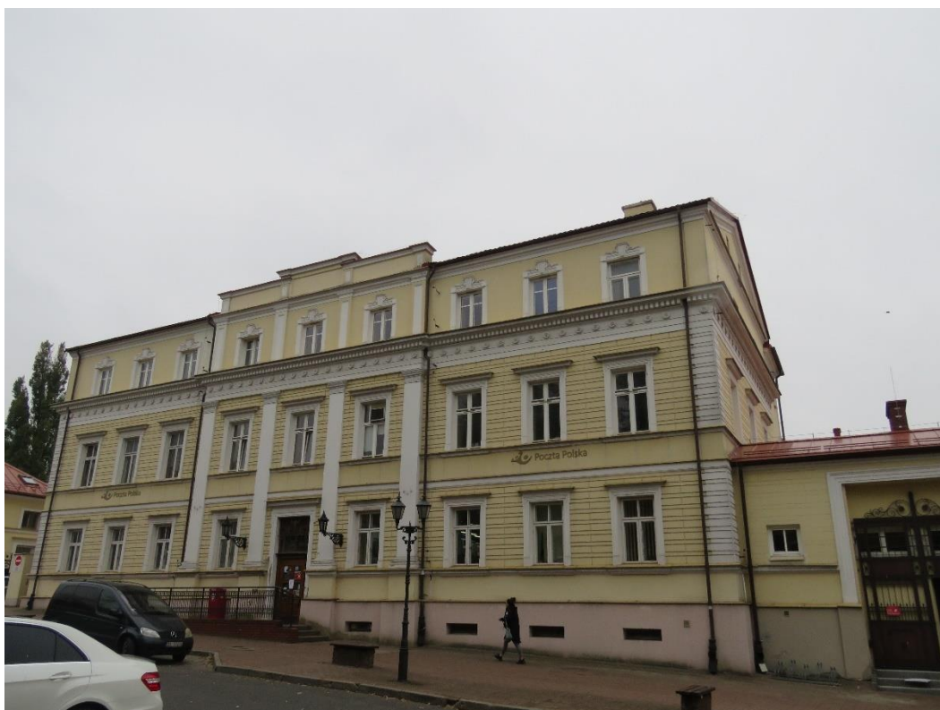
Budynek poczty, Plac Pocztowy, 1843-1844 r.