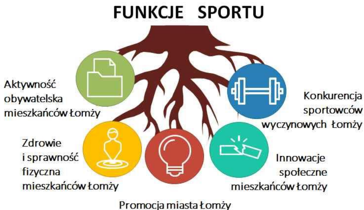
Rysunek 2: Funkcje sportu w Łomży