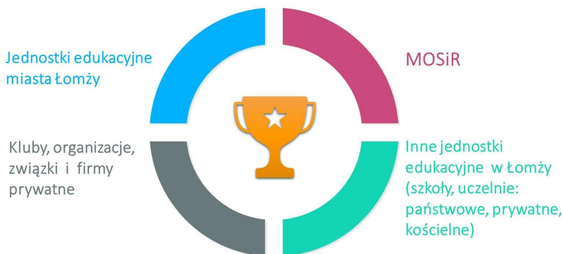
Rysunek 5: Gestorzy bazy sportowo-rekreacyjnej w Łomży