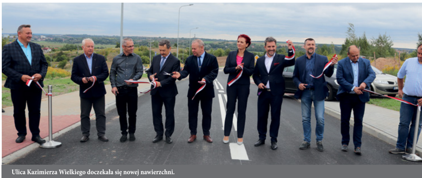
Ulica Kazimierza Wielkiego doczekała się nowej nawierzchni.