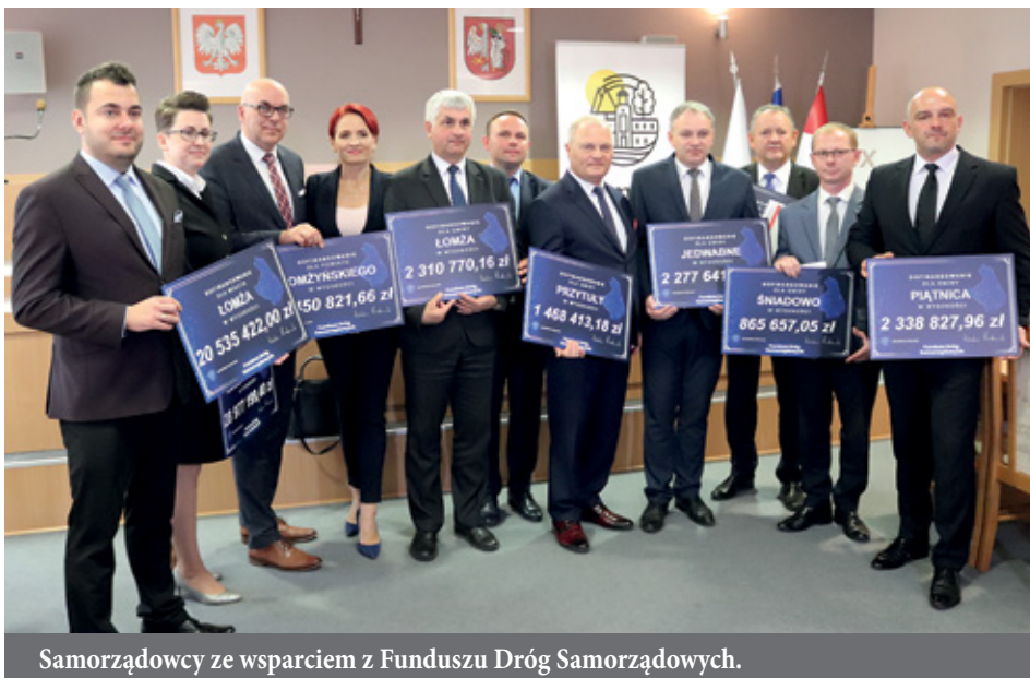
Samorządowcy ze wsparciem z Funduszu Dróg Samorządowych.

Dofinansowanie otrzymały również inne lo-