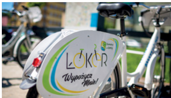
ŁoKeR-y są w Łomży bardzo popularne (fot. Kamil Brzostowski).

Wprowadzona w ubiegłym roku Łomżyńska Komunikacja Rowerowa (ŁoKeR) okazała się strzałem w "dziesiątkę". Mieszkańcy naszego miasta chętnie przemieszczają się po mieście, korzystając z dobrodziejstw, które niesie za sobą jazda jednośladem. ŁoKeR-owe stacje będą czynne do końca października.