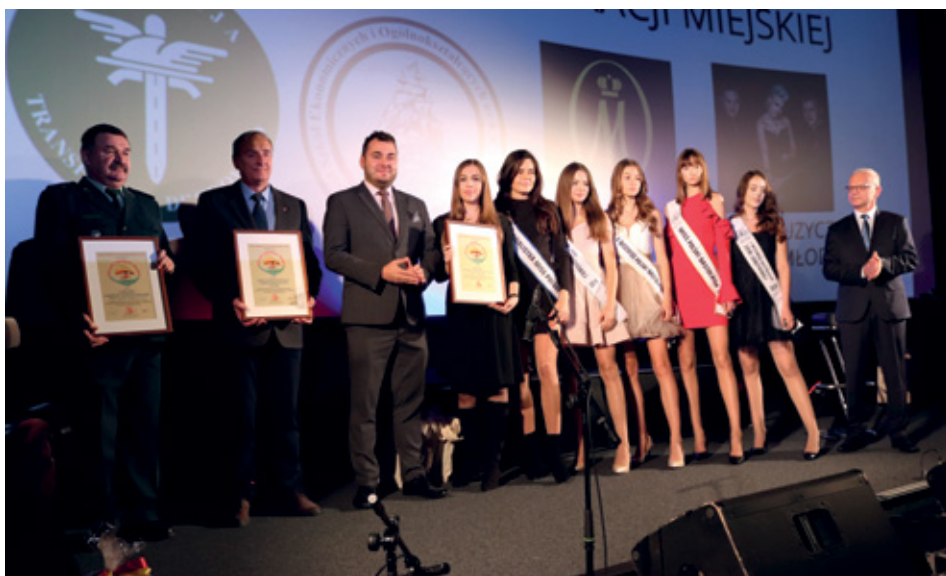
Uroczysta gala uświetniła jubileusz 50-lecia MPK.