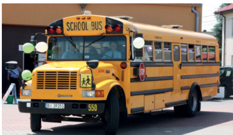
Autobus retro podczas obchodów Dnia Łomżyńskiej Komunikacji (fot. archiwum).

Bezpłatne przejazdy dla mieszkańców stają się powoli standardem usług miejskich świadczonych przez samorządy. W Łomży nie płacą za bilety również osoby, które ukończyły 60. rok życia i po-