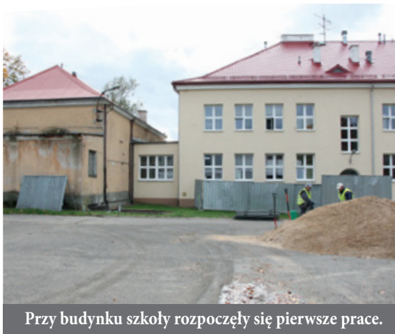
Przy budynku szkoły rozpoczęły się pierwsze prace.

Przy Szkole Podstawowej nr 2 rozpoczęły się prace archeologiczne. Są one związane z budową hali sportowej oraz boiska wielofunkcyjnego przy tej placówce. Oba obiekty powinny być gotowe do końca października przyszłego roku.