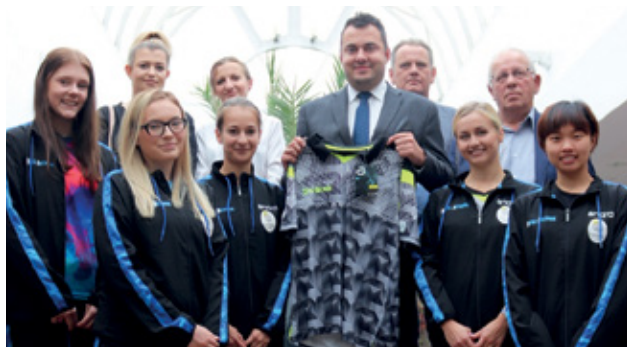
Tenisistki stołowe KU AZS PWSiP Metal-Technik w Urzędzie Miejskim w Łomży.