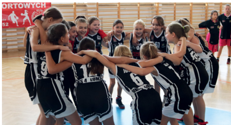
Koszykarki UKS 4 Łomża cieszą się ze zwycięstwa.

Bezkonkurencyjne okazały się młode koszykarki Uczniowskiego Klubu Sportowego 4 Łomża podczas VII Ogólnopolskiego Turnieju Koszykówki UKS 4 Łomża CUP 2019 o Puchar Prezydenta Miasta Łomża. Podopieczne trenera Marcina Piotrowskiego z kompletem zwycięstw stanęły na najwyższym stopniu podium.