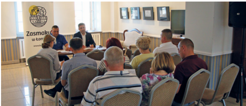
Ogłoszenie wyników odbyło się w Domku Pastora.

2. Wyposażenie minibułwarów nad Łomżyczką - miejsce rekreacji i wypoczynku oraz przedłużenie w stronę ul. Wojska Polskiego - rejon okolicy Łomżyczki na Łomżycy (ul. Sosno-