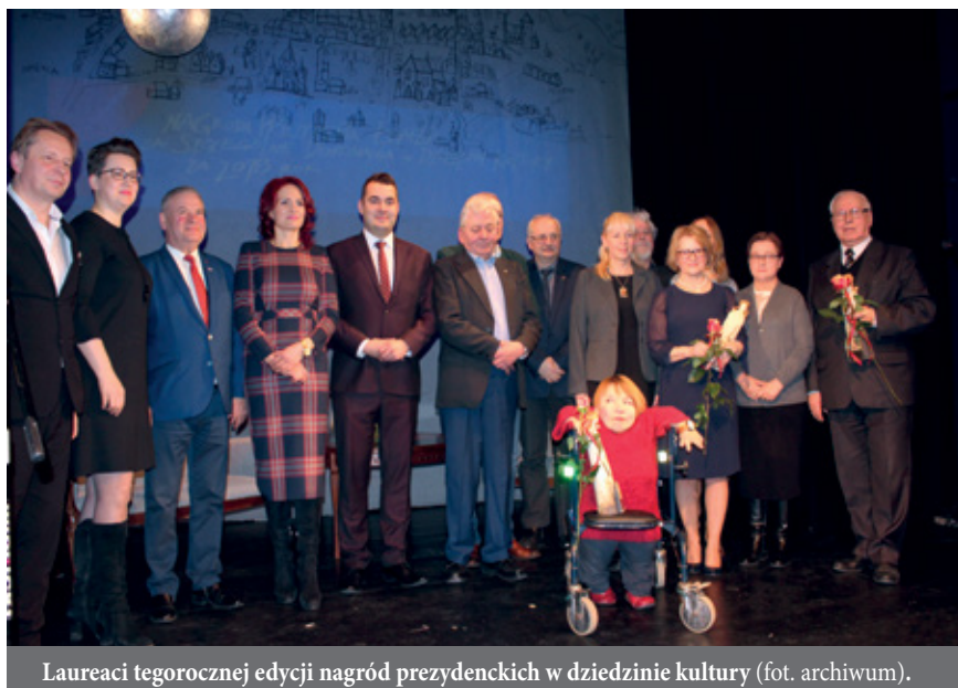
Laureaci tegorocznej edycji nagród prezydenckich w dziedzinie kultury.

Do końca października można zgłaszać kandydatów do Nagrody Prezydenta Miasta Łomży za szczególne dokonania w dziedzinie kultury. Mogą ją otrzymać twórcy, animatorzy, artyści, pracownicy łomżyńskich instytucji kultury indywidualnie lub grupowo. Wnioski o przyznanie nagród powinni składać: dyrektorzy instytucji kultury, związki twórcze, organizacje pozarządowe i organizator instytucji.