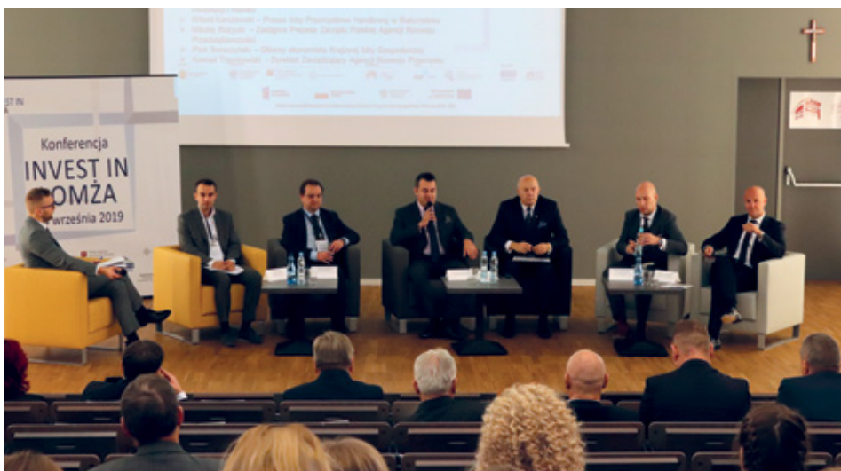
Debatą pn. "Łomża otwarta na nowe inwestycje - Open to new investments".

- Człowiek liczy się jako podstawa wszystkich inwestycji. Łomża może się pochwalić przede wszystkim tym, że może zaproponować potencjalnym inwestorom dużo ludzi gotowych pracować, dobrze wykształconych, mocno zmotywowanych do pracy. To jest jeden z istotniejszych warunków, jakie bierze się pod uwagę przy decyzjach o inwestycjach - mówił Piotr Soroczyński z Krajowej Izby Gospodarczej.