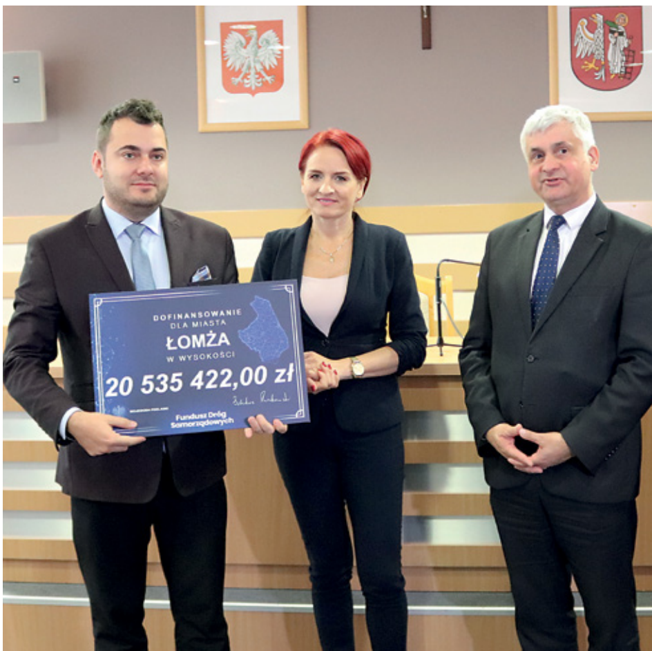
Promesa o wartości ponad 20,5 mln zł trafiła do Łomży.

- budowa ulic: Kazimierza Wielkiego, Stefana Batorego, Władysława Jagiełły, Królowej Jadwigi - wartość całkowita: 6 168 594,00 zł, dofinansowanie: 2 696 672,50 zł, realizacja: marzec - grudzień 2019 r.