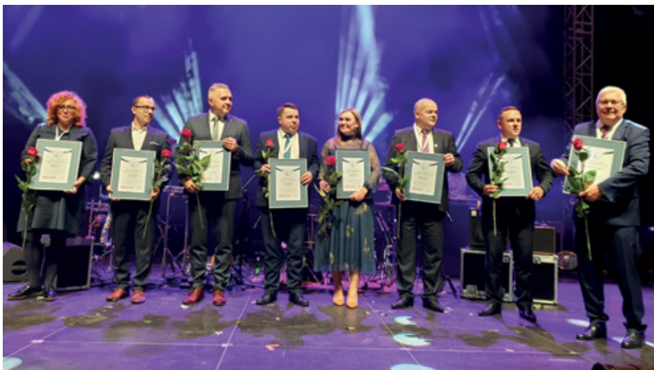
Laureaci kategorii "wykorzystanie środków unijnych na inwestycje transportowe w latach 2014–2018".

Gala Inwestorów Samorządowych była ukoronowaniem XVII edycji Samorządowego Forum Kapitału i Finansów. Wzięło w nim udział ponad