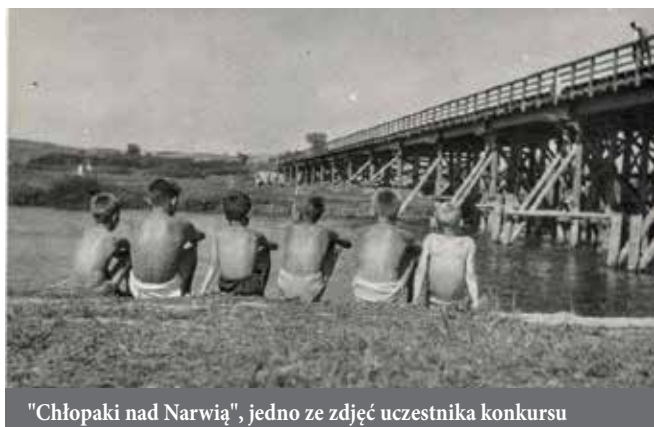
"Chłopaki nad Narwią", jedno ze zdjęć uczestnika konkursu