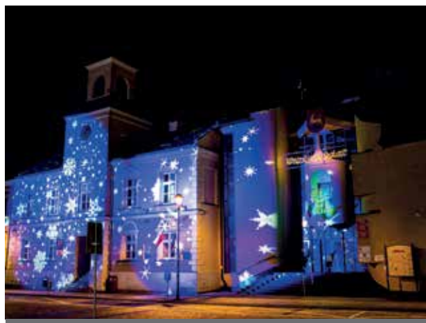
Świąteczne iluminacje na fasadzie Ratusza