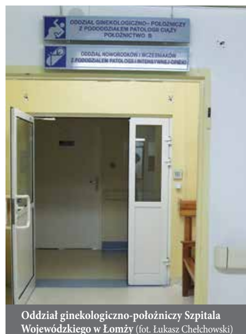
Oddział ginekologiczno-położniczy Szpitala Wojewódzkiego w Łomży