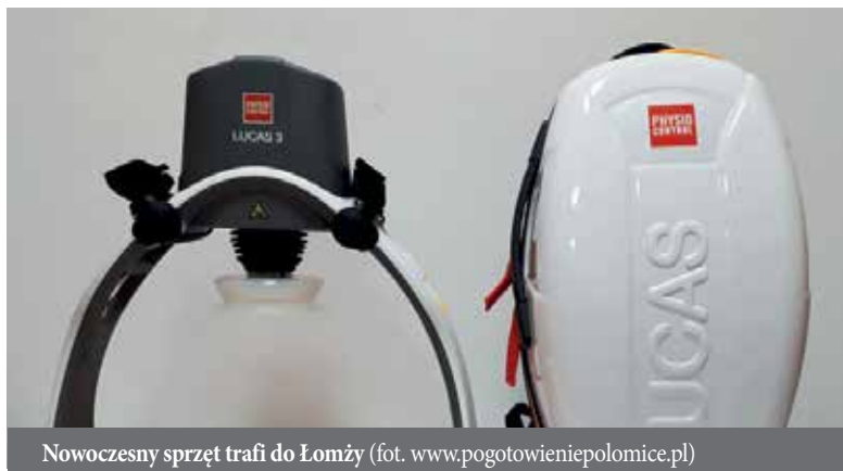
Nowoczesny sprzęt trafi do Łomży