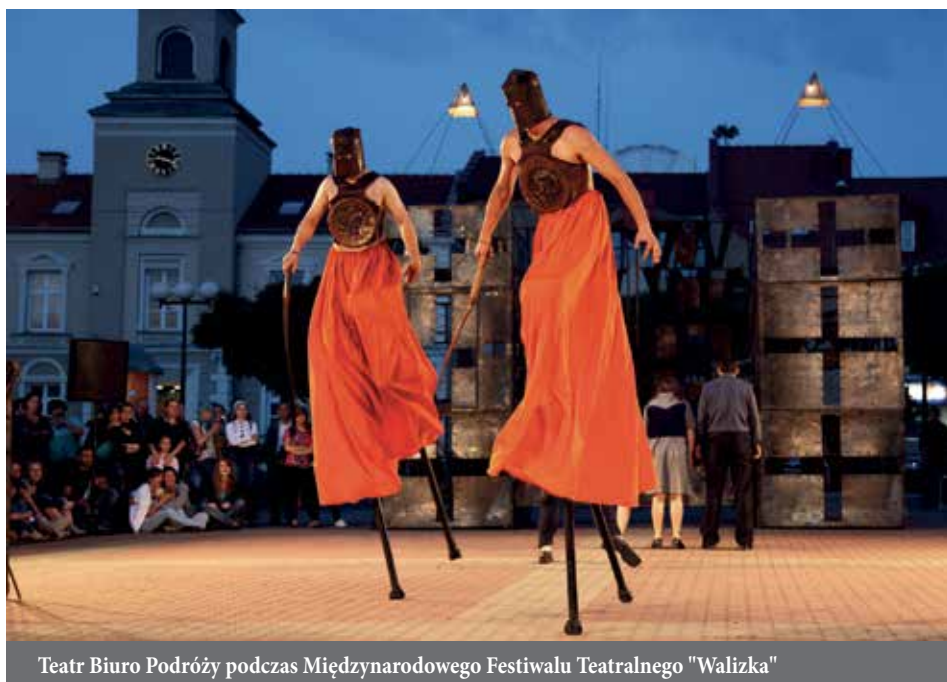
Teatr Biuro Podróży podczas Międzynarodowego Festiwalu Teatralnego "Walizka"

z całego świata. Działalność sceniczna teatru jest podporządkowana wyrazistemu programowi artystycznemu, który wynika z misji kształtowania wyobraźni i wrażliwości artystycznej, społecznej i interpersonalnej widza na każdym etapie jego życia – od wczesnych lat dziecięcych aż do późnej dorosłości – oraz tworzenia przestrzeni spotkania i dialogu.