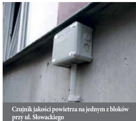
Czujnik jakości powietrza na jednym z bloków przy ul. Słowackiego