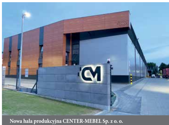
Nowa hala produkcyjna CENTER-MEBEL Sp. z o. o.