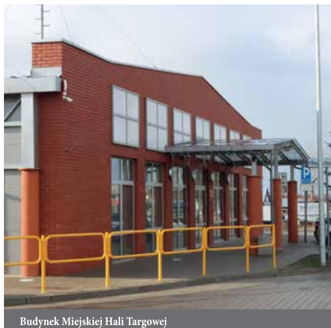
Budynek Miejskiej Hali Targowej

Od poniedziałku do piątku w godzinach od 7.00 do 17.00 oraz w każdą sobotę i niedzielę od 7.00 do 15.00 czynna jest Miejska Hala Targowa przy ulicy Sikorskiego. Znajduje się tam ponad 80 pawilonów handlowych z różnym asortymentem – zaczynając od odzieży, obuwia, a kończąc na zabawkach i artykułach przemysłowych codziennego użytku.