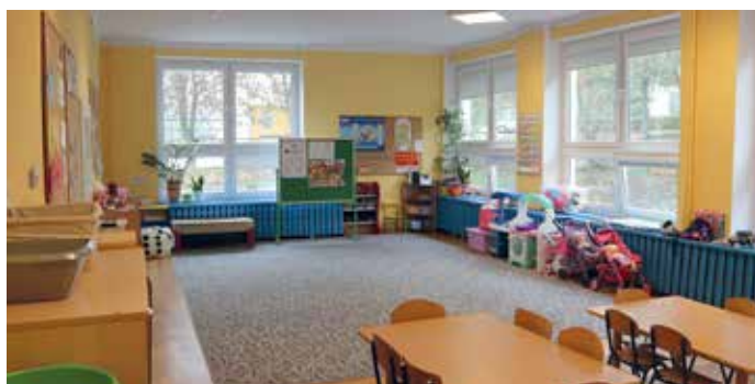
Publiczne Przedszkole nr 14, to tam powstanie trzeci żłobek w mieście