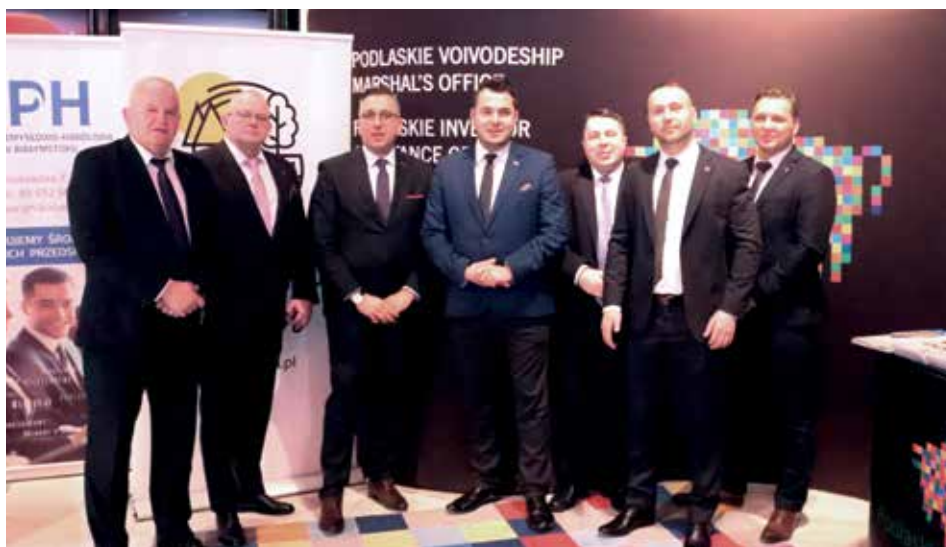
Łomżyńska delegacja w stolicy