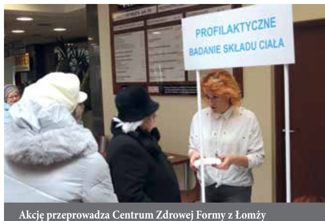
Akcję przeprowadza Centrum Zdrowej Formy z Łomży