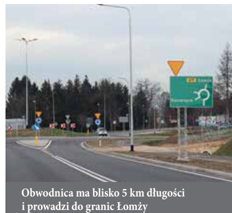
Obwodnica ma blisko 5 km długości i prowadzi do granic Łomży