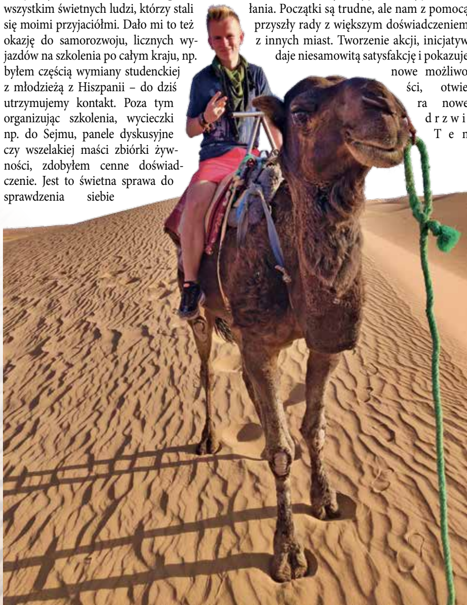
Sahara, podróż wraz z Nomadami

Od zawsze marzyłem, aby zwiedzać inne kraje i poznawać ludzi. Jednak było zbyt dużo barier takich jak pieniądze, organizacja, wiek. Musiałem więc znaleźć sposób, aby zrobić to w niekonwencjonalny sposób. Odpowiedź to autostop, tanie loty i Couchsurfing – darmowy transport i nocleg. Spytałem przyjaciela, czy zabrałby mnie w taką podróż. On wcześniej właśnie tak podróżował, a ja miałem zerowe doświadczenie. Podał mi termin i już po miesiącu byliśmy na wyspie. Okazało się, że taka podróż to znacznie więcej niż tylko tanie podróżowanie. Pamiętam kiedy pierwszy raz wyciągnąłem rękę z kciukiem podniesionym do góry, aby zatrzymać samochód. Czemu? Bo cała mi zdrętwiała. Było to – przynajmniej dla mnie – całkowite wyjście ze swojej strefy komfortu. Pierwsze chwile nie były łatwe, ale kiedy złapaliśmy "stopa" byłem najszcześliwszym człowiekiem na ziemi. Możliwość poznawania ludzi, obcowania z nimi i poznawania kultury od środka, oczami lokalnej spo-