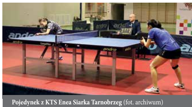
Pojedynek z KTS Enea Siarka Tarnobrzeg