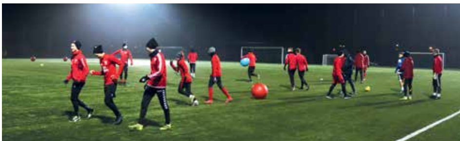
Trening łomżyńskich piłkarzy na sztucznym boisku MOSiR-u