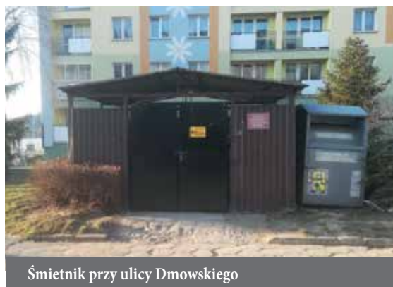
Śmietnik przy ulicy Dmowskiego