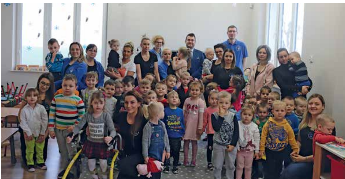
Prezydent Łomży Mariusz Chrzanowski zrobił z przedszkolakami pamiątkowe zdjęcie

Przedszkole zlokalizowane w nowoczesnym budynku przy ulicy Sybiraków w Łomży powstało we wrześniu 2019 r. Uczęszczają do niego dzieci 2,5 – roczne i starsze. Placówka jest prowadzona przez