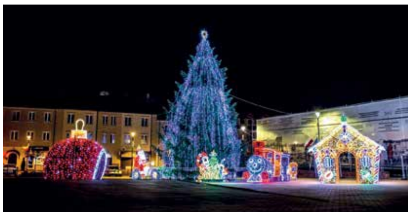
Rozświetlony łomżyński Stary Rynek

Łomża po raz czwarty zdobyła tytuł "Świetlnej Stolicy Województwa". Dzięki wygranej do naszego miasta trafi sprzęt AGD o wartości 10 tys. zł, który zostanie następnie przekazany osobom najbardziej potrzebującym. Gród nad Narwią zajął w tym roku 9. pozycję w finale ogólnopolskim plebiscytu "Świeć się z Energią".