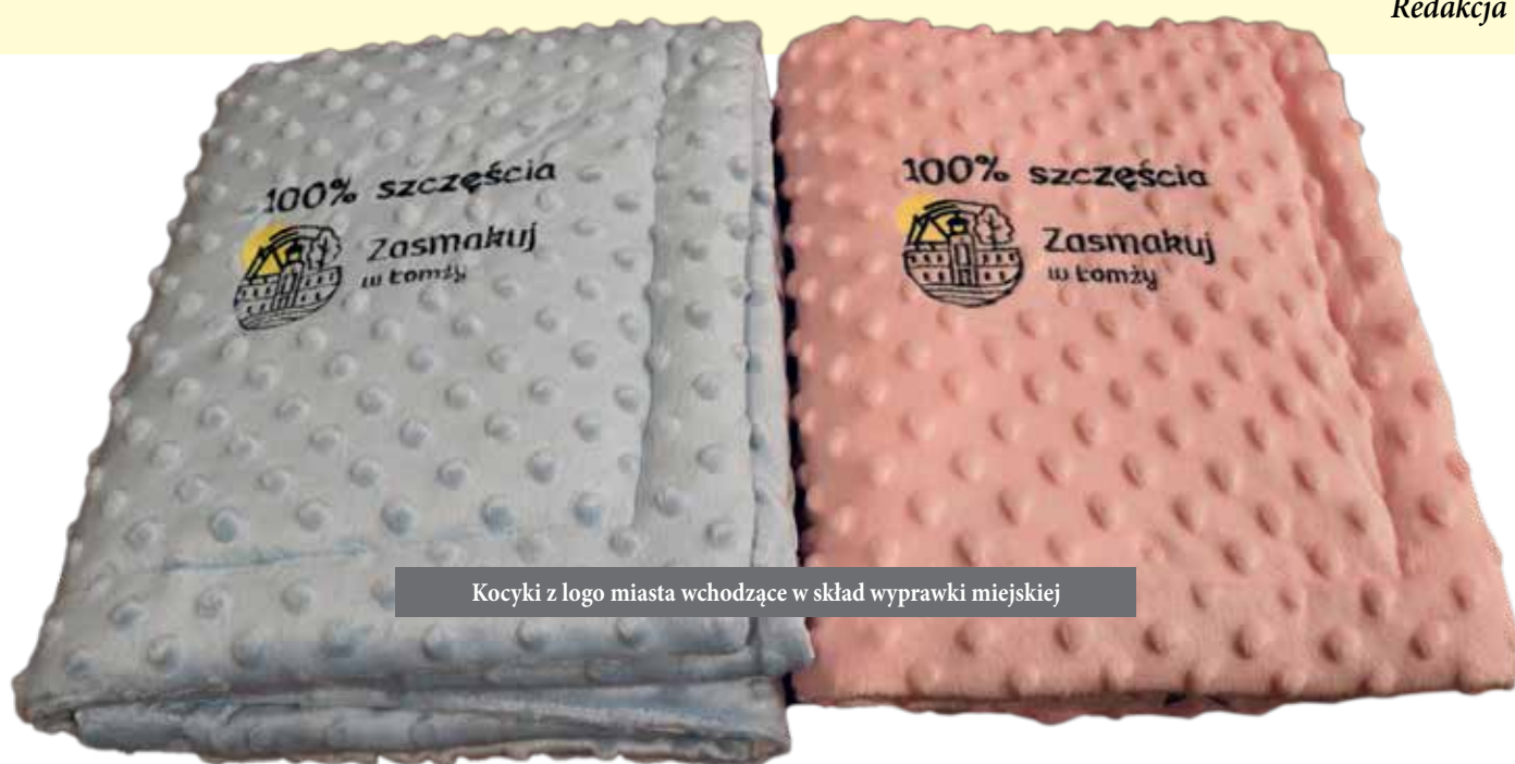
Kocyki z logo miasta wchodzące w skład wyprowadki miejskiej

Oprócz jednorazowego świadczenia w postaci 500 zł otrzymują oni wyprowadkę dla noworodka. Na początku był to sześcioczęściowy zestaw, w skład którego wchodziły body, półspiozki, śliniaczek, łapki nienapki, czapeczka i myjka z logo miasta oraz maskotka, kultowy już miś Łomżatek. W roku jubileuszowym był to koczek z logiem 600-lecia Miasta Łomża, okolicznościowa moneta oraz dodatkowo voucher rodzinny z pakietem sześciuset minut do wykorzystania w Parku Wodnym przy ul. Wyszyńskiego lub Pływalni Miejskiej nr 1 przy ul. Niemcewicza. Od ubiegłego natomiast jest to koczek z logiem miasta oraz w dalszym ciągu pakiet promocyjny na basen.