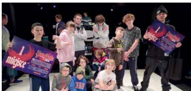
Tancerze breakdance zdobyli dwa pierwsze miejsca na turnieju Youngbloods Arena