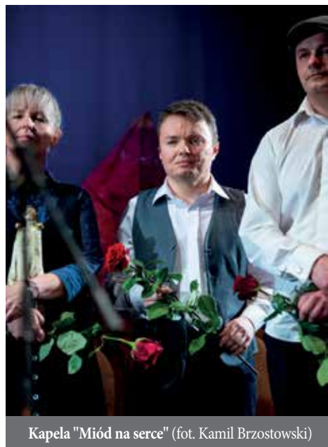
Kapela "Miód na serce"