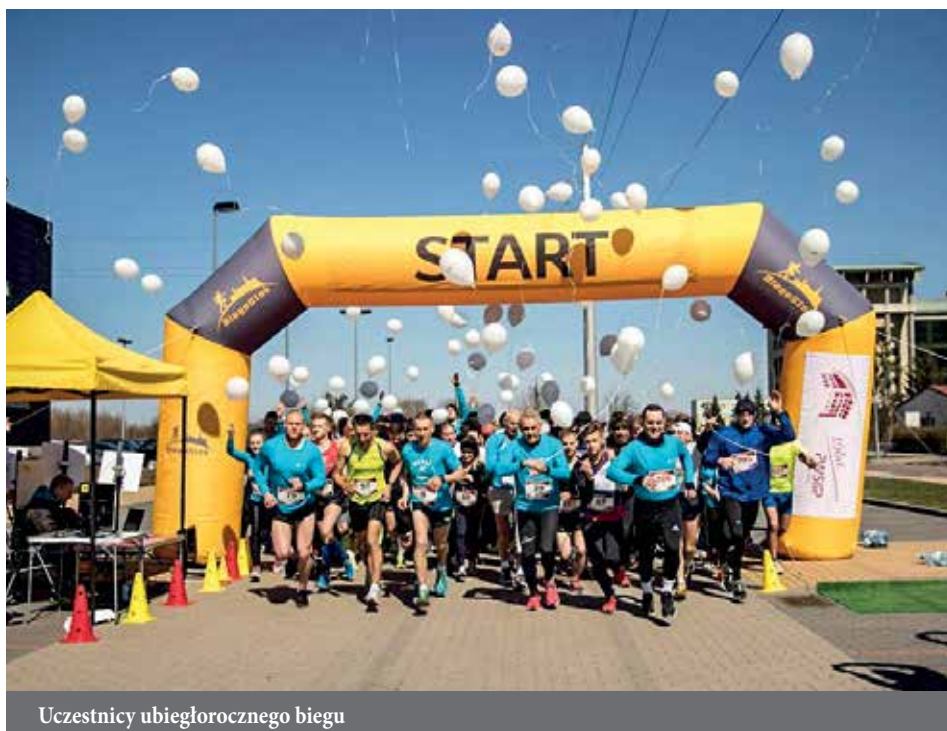
Uczestnicy ubiegłorocznego biegu

Jeszcze nie tak dawno zdawało się, że bieganie w zawodach pozostaje w domenie nadzwyczaj wysportowanych entuzjastów tej dyscypliny, którzy tygodniami przygotowują się do startu na konkretnym dystansie. Nic bardziej mylnego, bo od dobrych kilku lat ten sport w Polsce zyskuje coraz więcej zwolenników. Widać to zarówno na wielkich zawodach, gdzie miejsc dla zainteresowanych brakuje już dobre kilka tygodni przed startem, a także na wydarzeniach organizowanych przez lokalnych społeczników promujących zdrowy styl życia. A jak to wygląda w Łomży? W tym roku po raz drugi Państwowa Wyższa Szkoła Informatyki i Przedsiębiorczości zaprasza na Otwarte Akademickie Mistrzostwa w Biegu Ulicznym.