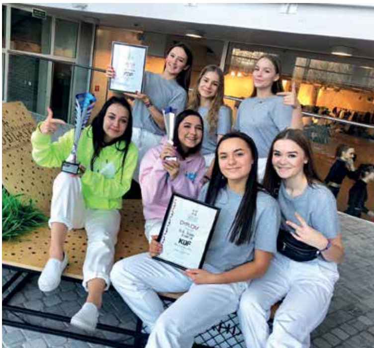
Zwycięska grupa B.K. Team