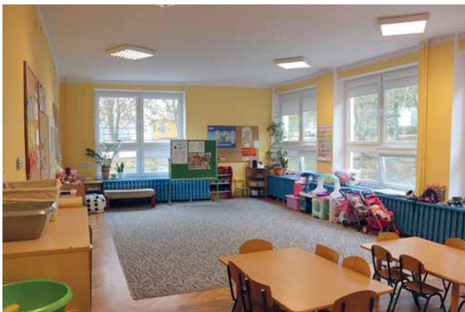
Miejski Żłobek nr 3 powstanie przy Przedszkolu Publicznym nr 14