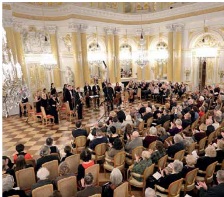
Koncert łomżyńskich filharmoników na Zamku Królewskim w Warszawie

Orkiestra Filharmonii Kameralnej im. Witolda Lutosławskiego z powodzeniem zainaugurowała koncertowy cykl "Nie tylko klasycznie" w Sali Wielkiej Zamku Królewskiego w Warszawie. Wraz ze skrzypkiem Jakubem Jakowiczem i wiolonczelistą Tomaszem Strahlem artyści wykonali współczesny repertuar polskich kompozytorów, w tym utwory pochodzące z płyty nagrodzonej ubiegłorocznym Fryderykiem.