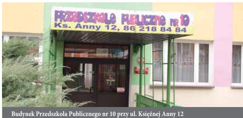
Budynek Przedszkola Publicznego nr 10 przy ul. Księżnej Anny 12