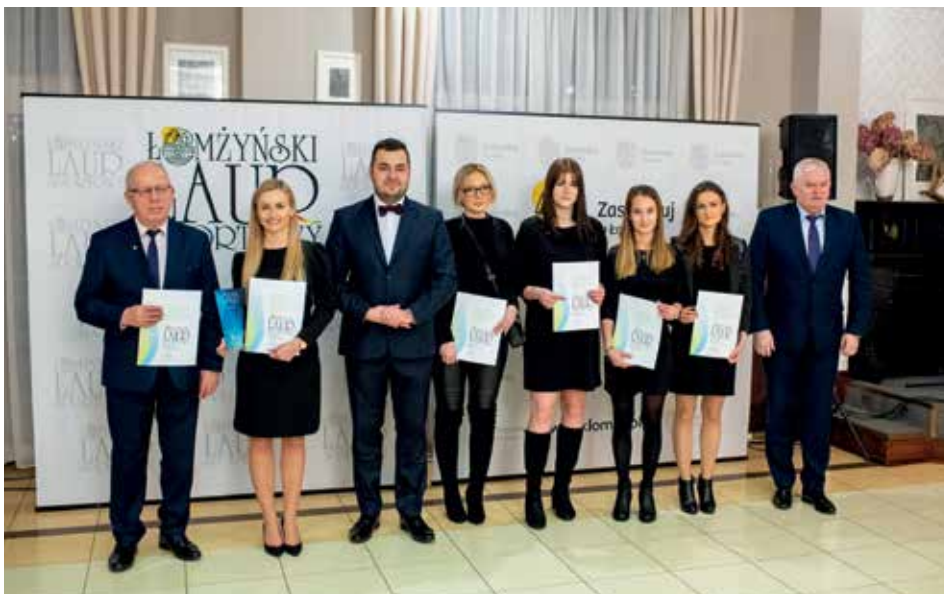
Drużyna roku 2019: KU AZS PWSiP Metal-Technik Łomża