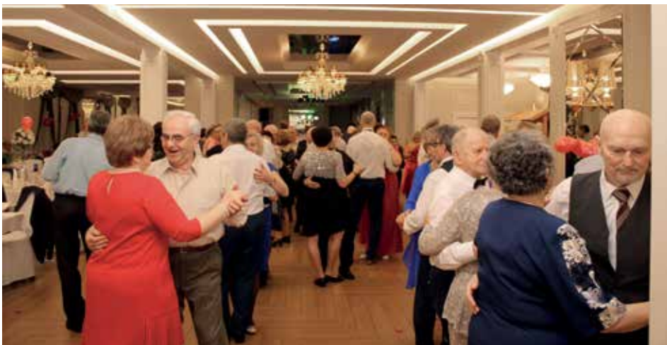
Seniorzy po raz kolejny pokazali, że potrafią się wspaniale bawić