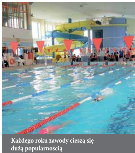
Każdego roku zawody cieszą się dużą popularnością

To jedna z największych imprez pływackich w regionie, którą cyklicznie organizuje Miejski Ośrodek Sportu i Rekreacji w Łomży. Tegoroczna siódma edycja 24. Godzinnego Maratonu Pływackiego odbędzie się w Parku Wodnym przy ul. Wyszyńskiego 15 w dniach 21-22 marca. Zapisy już ruszyły.