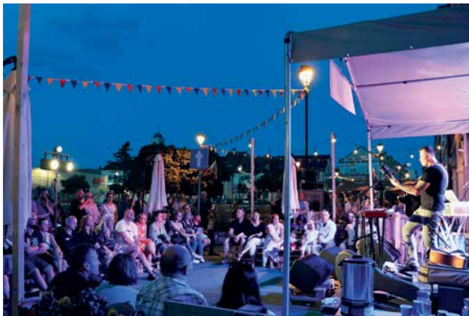
Cafe Kultura na Starym Rynku

Pole działania Miejskiego Domu Kultury – Domu Środowisk Twórczych jest bardzo szerokie. Poczynając od edukacji kulturalnej, poprzez promocję lokalnej kultury i współpracę z lokalnymi twórcami oraz animatorami życia kulturalnego, do propozycji artystycznych i prezentowania ich łomżyńskiej publiczności.