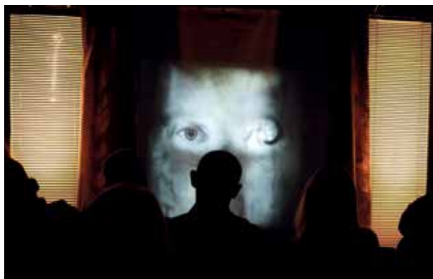
Spotkania z kulturą w ramach Off-Road