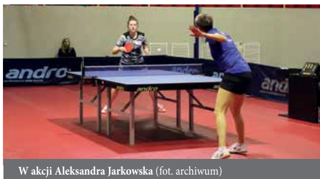
W akcji Aleksandra Jarkowska