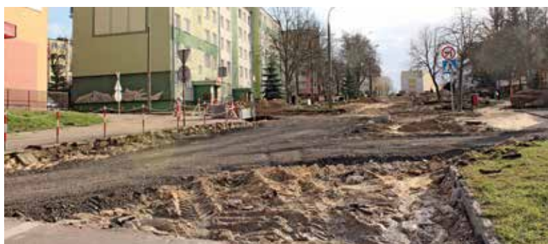
Ulica Małachowskiego