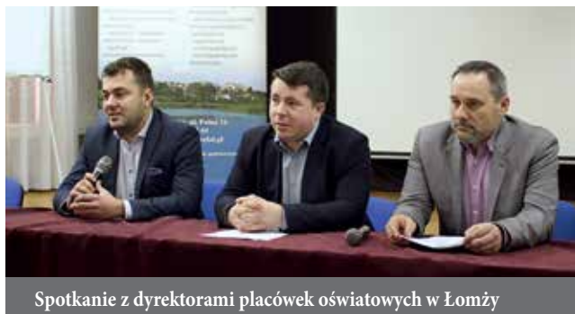
Spotkanie z dyrektorami placówek oświatowych w Łomży

terenie całego kraju stan zagrożenia epidemicznego. - W obliczu światowej epidemii, czy ogłoszonej pandemii najważniejsze słowa to bezpieczeństwo i odpowiedzialność. Jesteśmy zobowiązani do (...) wykonania wszystkich możliwych kroków, żeby bezpieczeństwo Polaków, zdrowotne i pod wszelkimi możliwymi względami było utrzymane