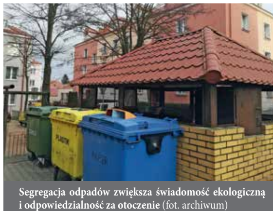
Segregacja odpadów zwiększa świadomość ekologiczną i odpowiedzialność za otoczenie

w wysokości 50% miesięcznej stawki opłaty będą mogli liczyć właściciele nieruchomości, na których zamieszkują mieszkańcy, których dochód nie przekracza kwoty uprawniającej do świadczeń pieniężnych z pomocy społecznej oraz rodziny wielodzietne, o których mowa w ustawie z dnia 5 grudnia 2014 r. o Karcie Dużej Rodziny. Ponadto zwolnienie w wysokości 1 zł miesięcznie od mieszkańca danej nieruchomości będzie przysługiwało właścicielom nieruchomości zabudowanych budynkami mieszkalnymi jednorodzinnymi kompostujących bioodpady stanowiące odpa-