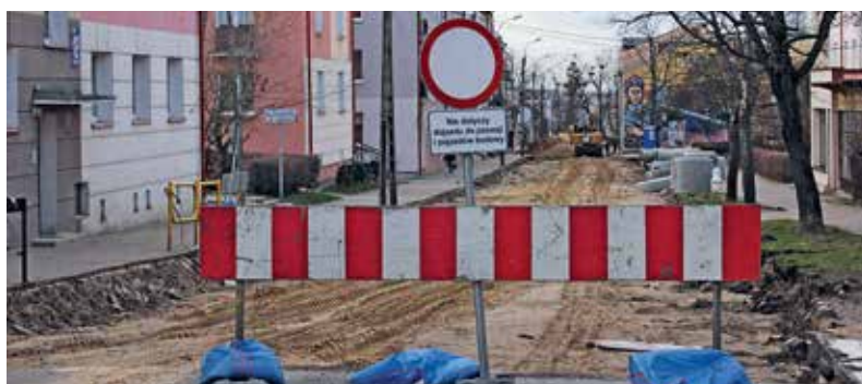
Ulica Rządowa