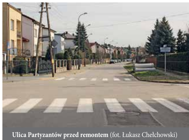
Ulica Partyzantów przed remontem