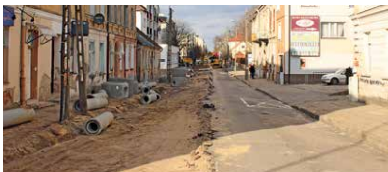
Ulica 3 Maja