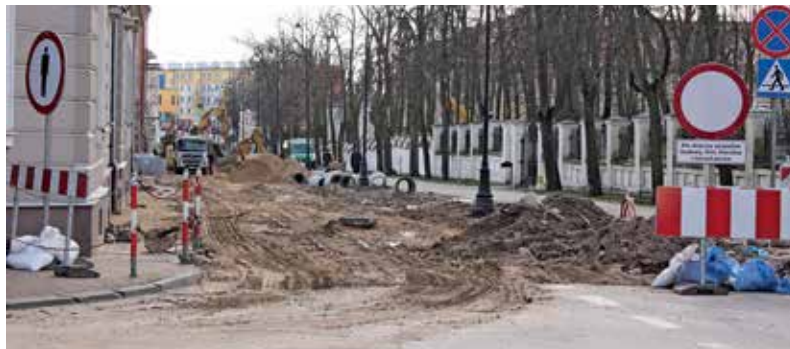
Ulica Giełczyńska