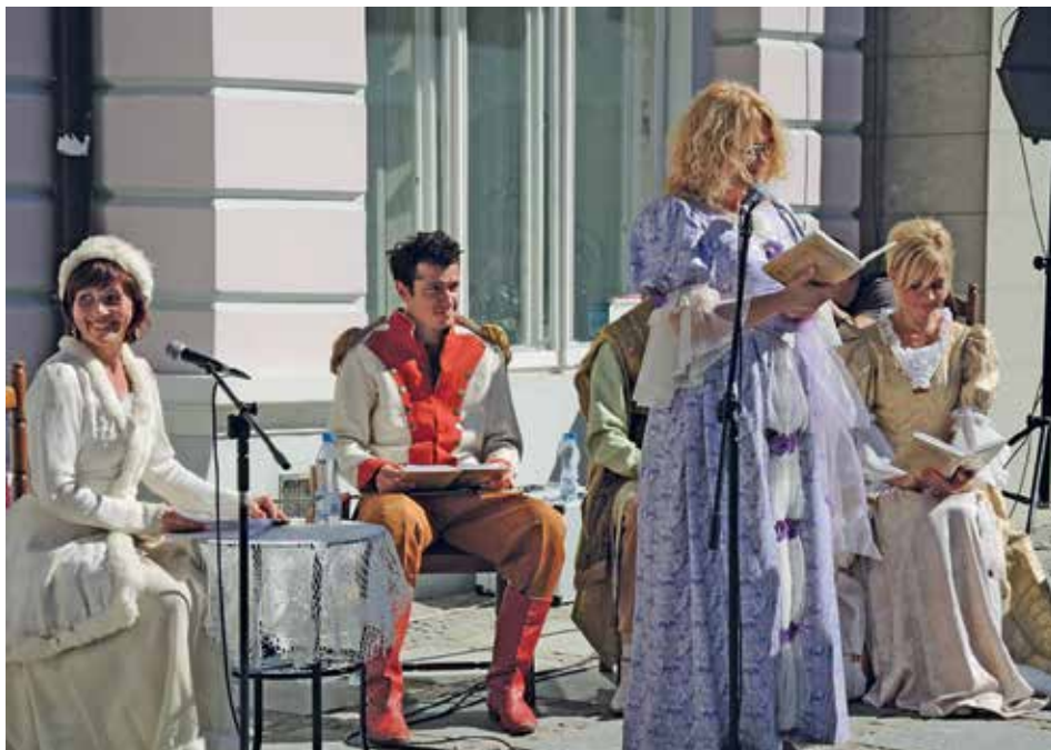
"Narodowe Czytanie" to ogólnopolskie wydarzenie, w którego organizację włącza się Miejska Biblioteka Publiczna w Łomży

Miejska Biblioteka Publiczna w Łomży jest instytucją kultury działającą nieprzerwanie od ponad 70 lat. Początkowo mieściła się w budynku przy ul. Giełczyńskiej 7, na przestrzeni lat książki wypożyczano też w Domu Kultury przy ul. Sadowej 12, potem na ul. 3 Maja 6A, a w 1997 r. została przeniesiona do kamienicy przy ul. Długiej 13, gdzie funkcjonuje do dnia dzisiejszego. Przez całe dekady biblioteka zmieniała również swoją strukturę i zasięg działania.