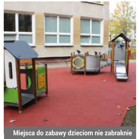
Miejsca do zabawy dzieciom nie zabraknie