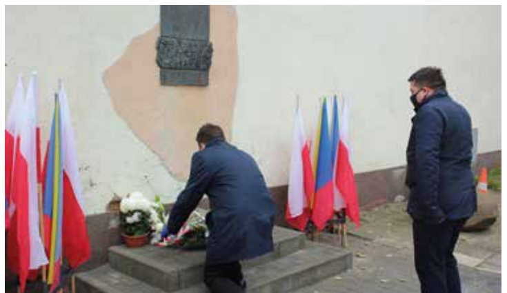
Pamięć łomżyńskich Żydów uczciły władze miasta