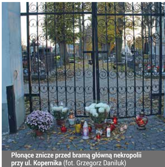
Płonące znicze przed bramą główną nekropolii przy ul. Kopernika

Zamknięcie cmentarzy rozporządzeniem rządowym spowodowało, iż tegoroczne święto 1 listopada było diametralnie inne od wszystkich poprzednich. Przyjęło ono charakter czysto duchowy. Polacy myślami łączyli się i wspominali bliskich zmarłych, wielkich bohaterów narodowych i poległych w obronie ojczyzny żołnierzy.