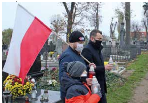
Symboliczne zapalenie zniczy na grobie Leona Kaliwody i mogiłach żołnierskich znajdujących się na zabytkowym cmentarzu przy ul. Mikołaja Kopernika