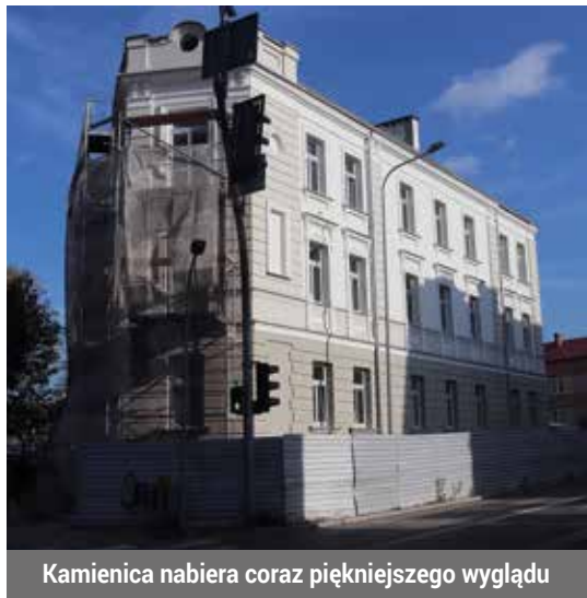
Kamienica nabiera coraz piękniejszego wyglądu

Charakterystyczna kamienica u zbiegu ulic Polowej i Wojska Polskiego jeszcze do niedawna szpecila swoim wyglądem. Dzięki prowadzonej termomodernizacji niebawem stanie się jednym z piękniejszych zabytkowych budynków w Łomży. Choć prace zakończą się w maju przyszłego roku, to pierwsze ich efekty już widać od strony ulicy Polowej.