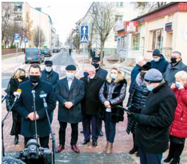
Briefing prasowy

W listopadzie zakończyły się prace związane z przebudową ulic 3 Maja i Wiejskiej w Łomży. Podsumowanie tych inwestycji odbyło się na początku grudnia na nowym parkingu, który został wybudowany w miejscu dawnej stacji CPN.