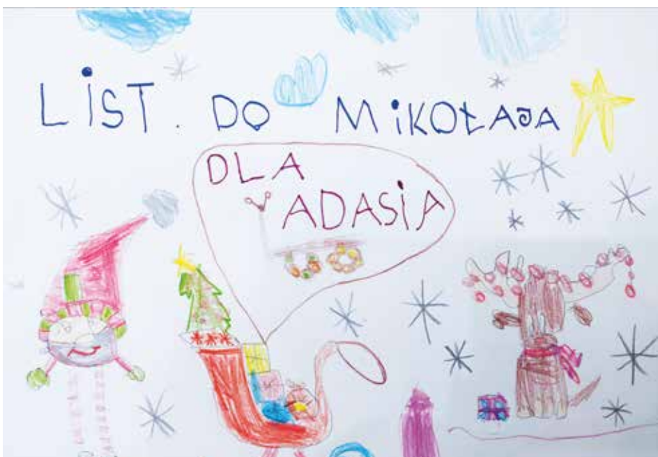
Zwycięska praca Adama Kruszewskiego w kat. przedszoła