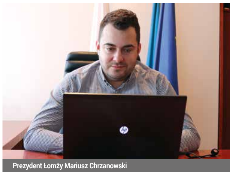
Prezydent Łomży Mariusz Chrzanowski

Rok 2020 był na pewno specyficzny chyba pod każdym względem, ze względu na ogólnosięwiatową pandemię koronawirusa. Dwanaście miesięcy temu wszyscy zupełnie inaczej sobie go wyobrażaliśmy, każdy miał co do niego jakieś swoje plany. Nowa rzeczywistość, która rozpoczęła się w marcu, bardzo mocno to wszystko zweryfikowała na każdym szczeblu naszego życia, nie tylko zawodowego, ale i osobistego.