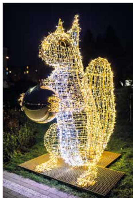
Wiewiórka z orzechem