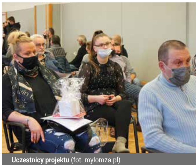
Uczestnicy projektu

W sali gimnastycznej przy ul. Rybaki odbyło się uroczyste podsumowanie pierwszego naboru do projektu "Regionalne Innowacje Społeczne - Centra Integracji Społecznej województwa podlaskiego". Nowe umiejętności zdobyło 40 osób. Uczestnicy odebrali zaświadczenia, dyplomy oraz upominki.