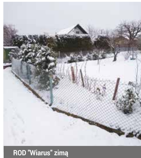
ROD "Wiarus" zimą