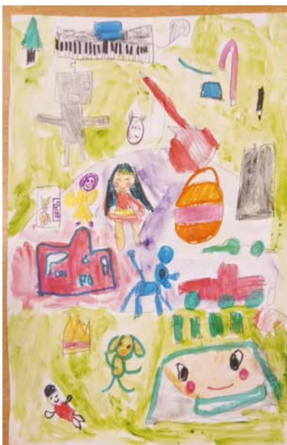
Praca Zofii Oleksy (trzecie miejsce w kat. przedszoła)