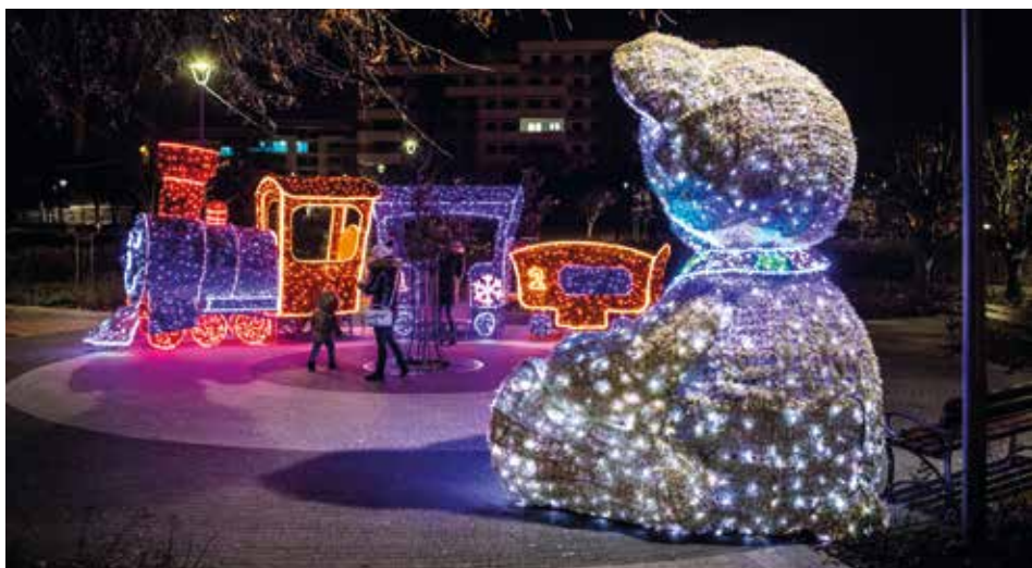
Słynny Miś Łomżatek i wielokolorowa lokomotywa z wagonikami

W tym roku, z uwagi na trwającą rewitalizację Starego Rynku, najokazalsze dekoracje zostały umiejscowione w Parku Jana Pawła II – Papieża Pielgrzyma, nadając mu iście magicznego charakteru. Są też nowości, bo do kultowego Misia Łomżatka czy lokomotywy z wagonikami dołączyło pięć nowych elementów świetlnych.