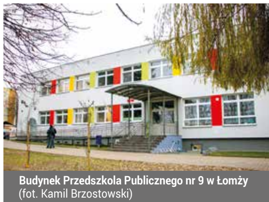
Budynek Przedszkola Publicznego nr 9 w Łomży