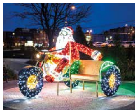
Święty Mikołaj na motocyklu