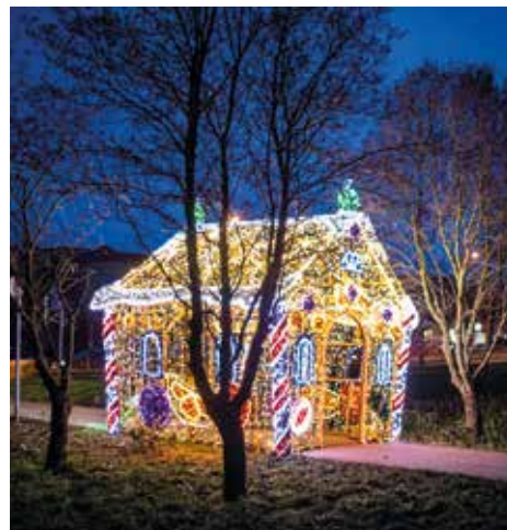
Piernikowy domek