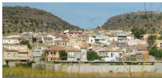
Panorama Montserrat