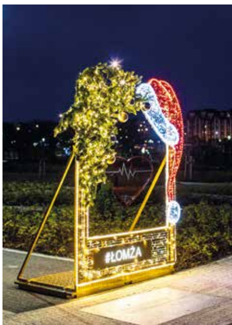
Fotorama z czapką św. Mikołaja