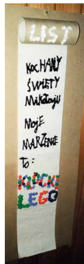
Zwycięska praca Dawida Wojewody w kat. klasy I-III