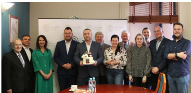
Zespół redakcyjny „My z Łomży” podczas jubileuszu

GD: To głównie mieszkańcy Łomży, którzy chcą wiedzieć, co się w mieście dzieje. Biuletyn jest źródłem informacji dla osób, które w niewielkim zakresie lub w ogóle, nie korzystają z Internetu. W ten sposób Urząd Miejski w Łomży stara się docierać z różnego rodzaju przekazami do wszystkich grup społecznych. Jednak nasi czytelnicy