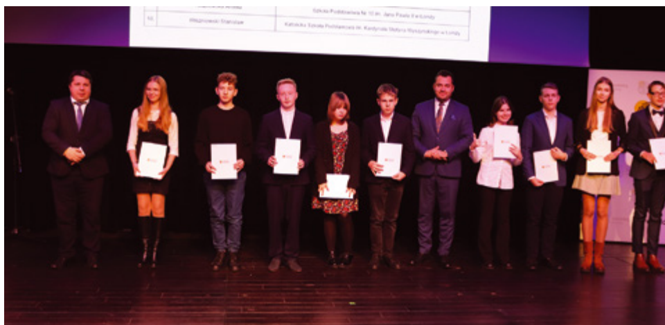
Najlepsi uczniowie z „podstawówek”