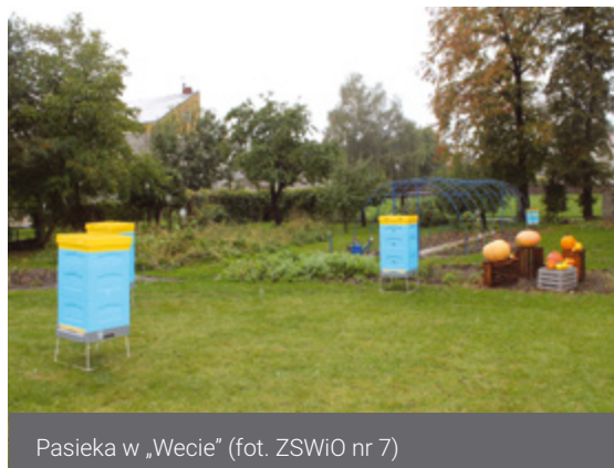
Pasieka w „Wecie”

Równocześnie prowadzone są starania o otwarcie kierunku technik pszczelarz. W tym celu szkoła organizuje tematyczne stanowiska podczas uroczystości szkolnych oraz wyjazdy promujące. Młodzież bierze również udział w konkursach pszczelarskich.