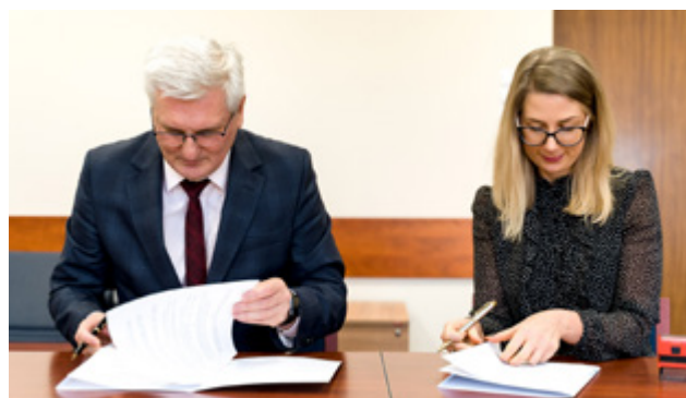
Moment podpisania porozumienia