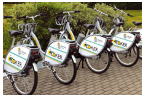
Jednoślady zyskują w Łomży coraz większą popularność

Z ŁoKeRów można było korzystać od 7 lipca do 31 października. W tym roku system rowerowy w Łomży zyskał nowy, odświeżony wygląd. Składał się z 15 stacji, fabrycznie nowych 100 pojazdów tradycyjnych i 30 elektrycznych czwartej generacji.