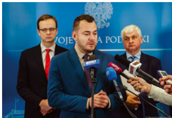
Briefing prasowy w Podlaskim Urzędzie Wojewódzkim w Białymstoku

Miasto Łomża po raz piąty przystępuje do Programu Opieka Wytchnieniowa, który cieszy się coraz większym zainteresowaniem opiekunów osób niepełnosprawnych. W 2023 roku wsparciem ma być objętych co najmniej 50 osób (20 dzieci i 30 dorosłych), przy jednoczesnym zatrudnieniu