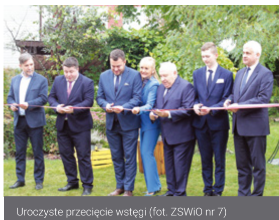
Uroczyste przecięcie wstęgi