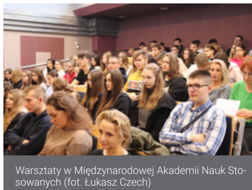
Warsztaty w Międzynarodowej Akademii Nauk Stosowanych

Pół tysiąca osób, uczniów szkół średnich i studentów, uczestniczyło w warsztatach zachęcających do wzięcia udziału w konkursie „Mój pomysł na biznes – Zabiznesuj w Łomży”. Odbłyły się one w dniach 16-17 listopada w siedzibach Międzynarodowej Akademii Nauk Stosowanych przy ul. Studenckiej 19 oraz Akademii Nauk Stosowanych przy ul. Akademickiej 14, podczas trwającego Światowego Tygodnia Przedsiębiorczości 2022.