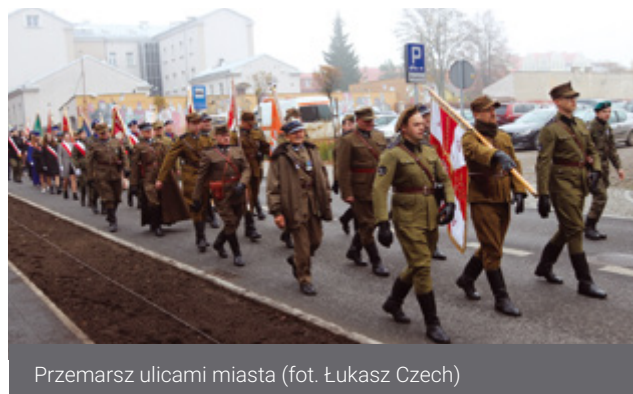
Przemarsz ulicami miasta

W Łomży odbyły się obchody 80. rocznicy powołania Narodowych Sił Zbrojnych, połączone z 74. rocznicą śmierci kapelana podziemia niepodległościowego, biskupa łomżyńskiego Stanisława Kostki Łukomskiego ps. „Rybak”.