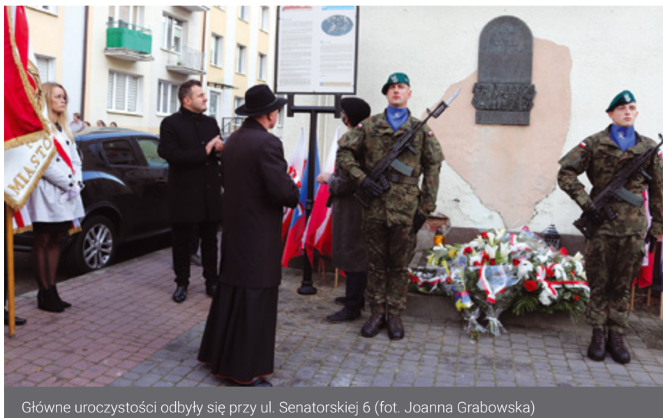
Główne uroczystości odbyły się przy ul. Senatorskiej 6

Na administracyjnym obszarze Bezirk Białystok niemieccy okupanci utworzyli łącznie 65 gett, z których największe zlokalizowano w Białymstoku, Grodnie i Łomży. 2 listopada 1942 roku około godziny 5 nad ranem hitlerowcy przystąpili do likwidacji getta nad Narwią, otwierając ostatni akt tragedii przeszło dziesięciotyśięcznej społeczności łomżyńskich Żydów.