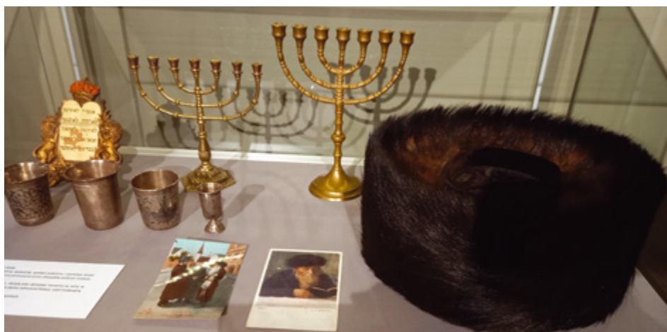
Obchody zainicjowało otwarcie wystawy w Muzeum Północno – Mazowieckim

- Ideologia, która przyszła postawiła sobie za cel eksterminację Żydów, wymazanie tego narodu z pamięci ludzkiej, z historii świata. Przywołujemy dziś w pamięci te wydarzenia, które miały miejsce zarówno w Łomży, jak i w wielu innych miejscach. Wspominamy też tych, którzy mimo obawy o własne życie pomagali swoim bliskim, sąsiadom, z którymi dzielili swoje radości