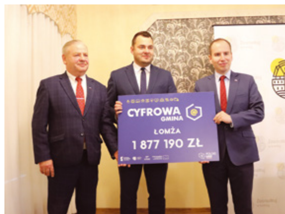
Symboliczne przekazanie czeku