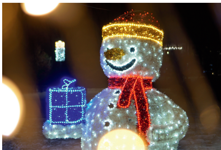
Okazały bałwanek po raz pierwszy zaprezentował się przechodniom parku