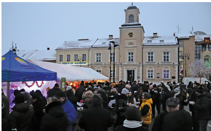
Każdy z uczestników mógł skosztować wigilijnych potraw