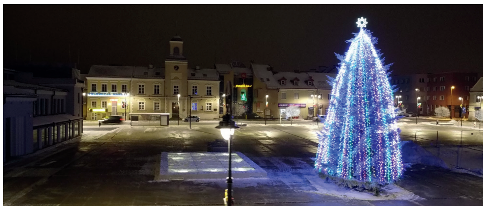
Świąteczna choinka na Starym Rynku