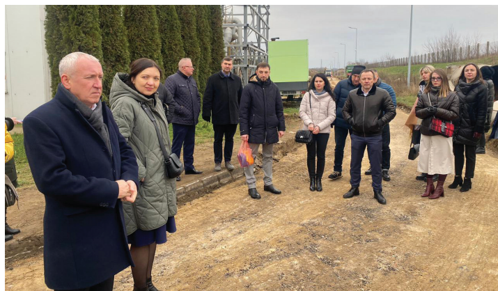
Wizyta studyjna w firmie MPWiK Sp. z o.o.