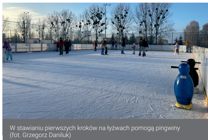
W stawianiu pierwszych kroków na łyżwach pomogą pingwiny