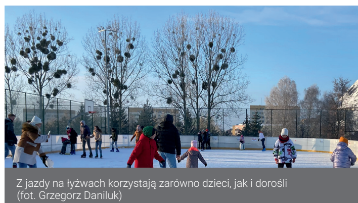
Z jazdy na łyżwach korzystają zarówno dzieci, jak i dorośli

Nowy sezon rozpoczął się na miejskim lodowisku przy ul. Katyńskiej. To dobra wiadomość dla miłośników zimowych aktywności – a jeszcze lepszą jest to, że ceny wejściówek pozostały na takim samym poziomie, jak w ubiegłym roku i wynoszą 5 zł za godzinę jazdy na łyżwach.