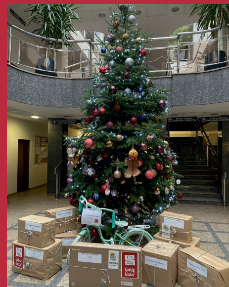
Paczki, które trafią do potrzebującej rodziny