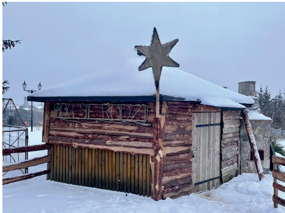
Budynek szopki jest już gotowy, 23 grudnia wejdą tam zwierzęta