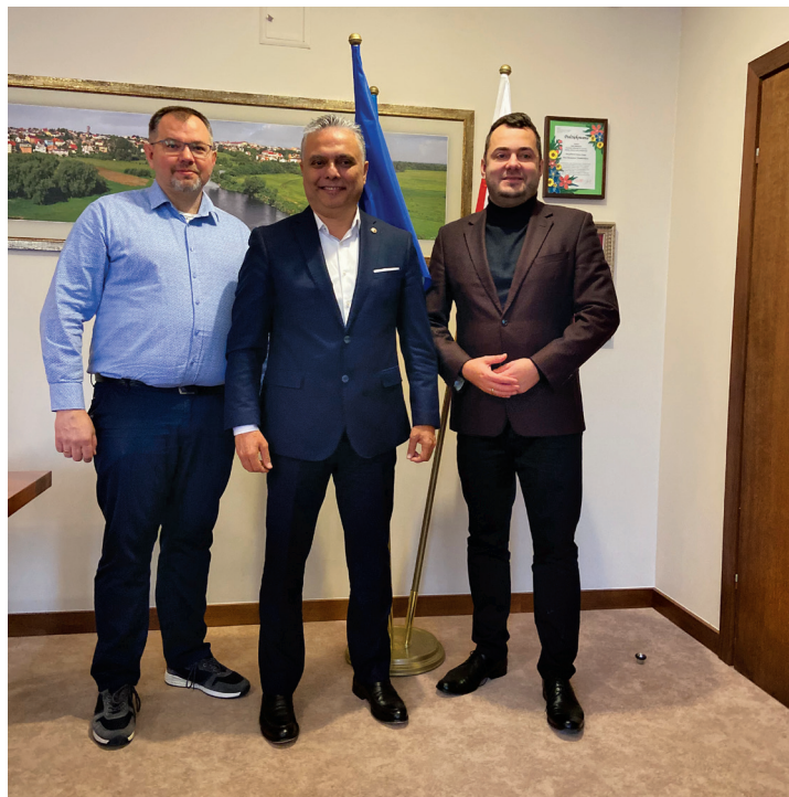
Spotkanie z burmistrzem Muratpasa w Antalyi Ümitem Uysalem