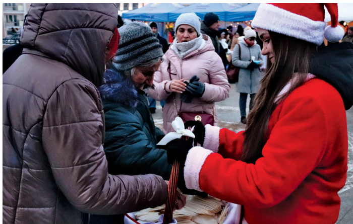
Mieszkańcy podzielili się opłatkiem