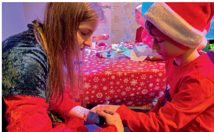
Atrakcji dla najmłodszych nie brakowało