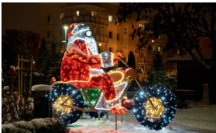
Mikołaj Motocyklista