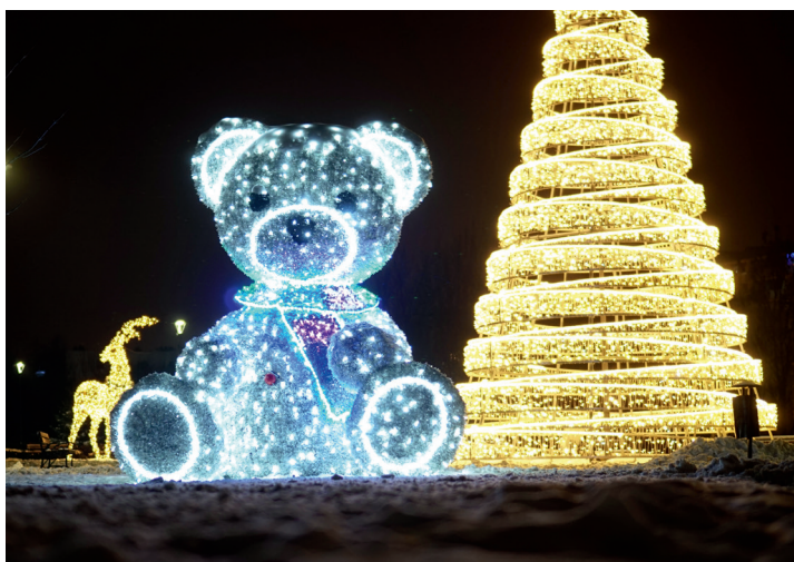
Słynny Miś Łomżatek