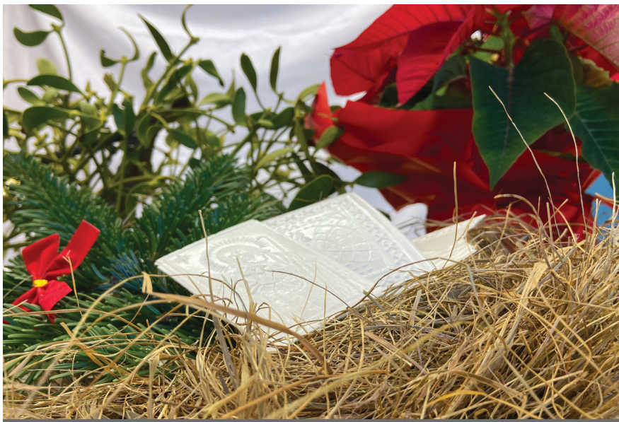
Nieodłącznym elementem Świąt Bożego Narodzenia jest opłatek

Łamanie się opłatkiem to najważniejszy punkt wigilijnej wieczerzy, wywodzący się już od pierwszych chrześcijan, którzy dzielili się chlebem. Jest on wyrazem pojednania i przebaczenia. Podczas łamania się opłatkiem, bliscy składają sobie życzenia, po czym zasiadają do kolacji wigilijnej. W niektórych domach moment ten poprzedza modlitwa oraz czytanie fragmentu Ewangelii wg św. Łukasza.