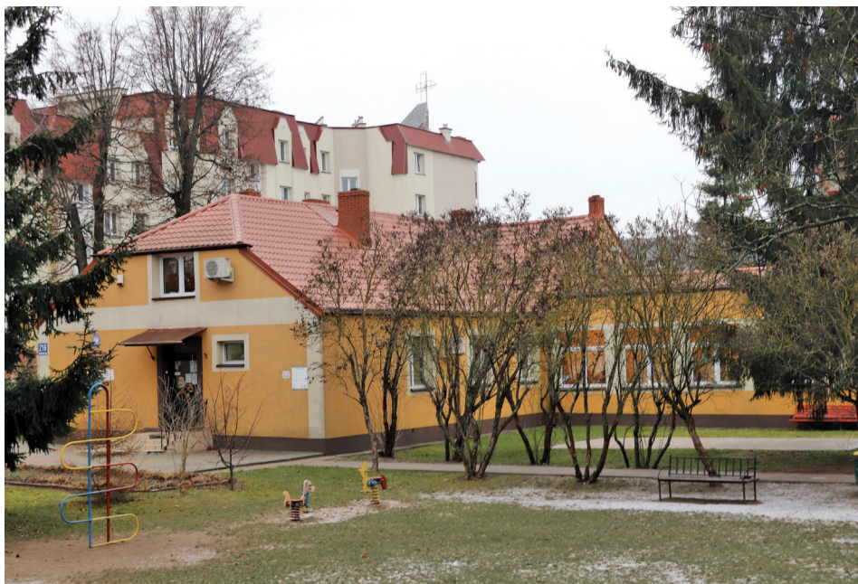
Tak obecnie wygląda budynek przedszkola

Zadanie pod nazwą Budowa Przedszkola Publicznego nr 5 w Łomży obejmuje budowę nowego budynku wraz