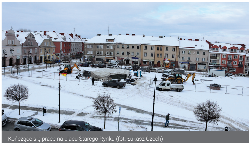
Kończące się prace na placu Starego Rynku

Właściciel Zakładu Drogowego „Kafil”, realizującego tę inwestycję nie ukrywa,