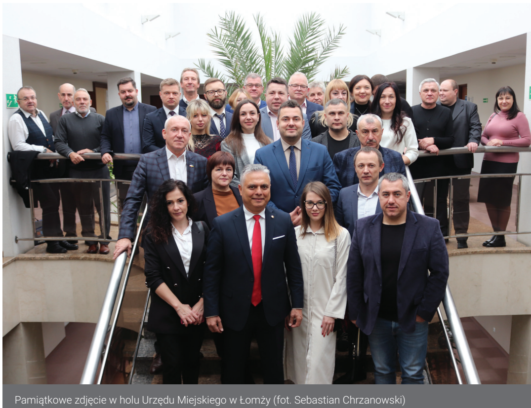
Pamiątkowe zdjęcie w holu Urzędu Miejskiego w Łomży

Spotkania w Urzędzie Miejskim z władzami Łomży, wizyty studyjne w przedsiębiorstwach, konferencja – to główne elementy, które towarzyszyły przyjazdowi delegacji miast partnerskich z zagranicy, poświęconemu rozwijaniu współpracy samorządowo-biznesowej. Wydarzenie odbyło się pod koniec listopada.