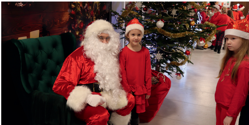
Największym zainteresowaniem cieszyło się spotkanie z Mikołajem