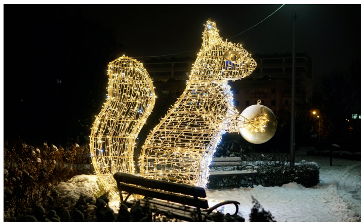
Wiewiórka z orzechem