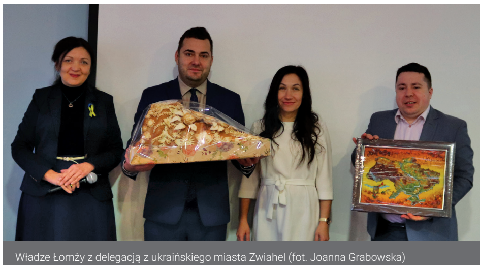
Władze Łomży z delegacją z ukraińskiego miasta Zwiahel

Ważnym elementem pobytu w Łomży były wizyty studyjne w lokalnych firmach, uczestnicy byli ponadto w Miejskim Przedsiębiorstwie Wodociągów i Kanalizacji