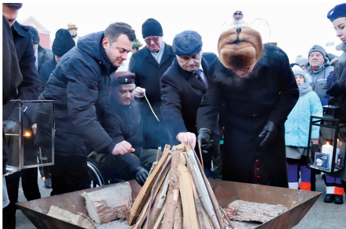
Ogień, który posłużył do rozpalenia ogniska pochodził z Groty Narodzenia Pańskiego w Betlejem

Władze miasta nie zapomniały również o najbardziej potrzebujących. Wzorem lat ubiegłych w dniu 24 grudnia w godzinach od 9:00-12:00, w ramach tzw. wigilii mobilnej, w trzech punktach Łomży staną specjalne autobusy Miejskiego Przedsiębiorstwa Komunikacji, z których wolontariusze oraz żołnierze wydawać będą paczki ze świątecznym posiłkiem osobom samotnym i ubogim. Hermetycznie zapakowane porcje będą wręczane na Placu Niepodległości, przy Parku Wodnym (ul. Wyszyńskiego 15) oraz na parking przy Międzynarodowej Akademii Nauk Stosowanych (ul. Studenckiej 19).