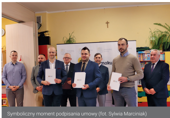
Symboliczny moment podpisania umowy

W piwnicy ulokowane będą pomieszczenia magazynowe powiązane z zapleczem kuchni, wymiennikownia oraz magazyny dla żłobka i przedszkola.