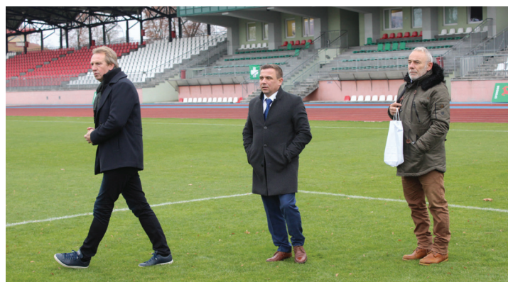
Wizyta na Stadionie Miejskim przy ul. Zjazd

Sp. z o.o. oraz wizytowali należącą do spółki stację uzdatniania wody w Podgórzu.