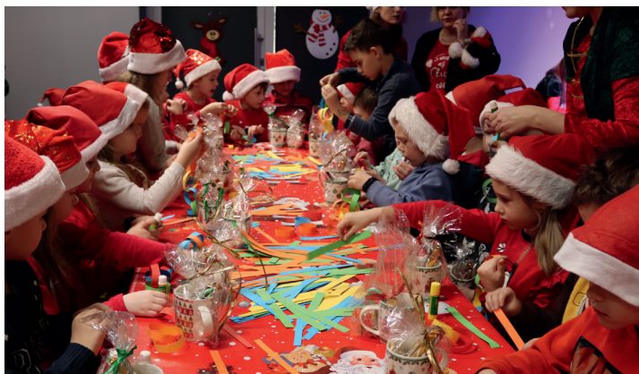
Dzieci wykonywały łańcuchy na choinkę z wycinanek