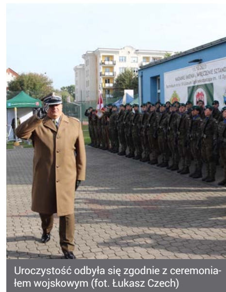
Uroczystość odbyła się zgodnie z ceremoniałem wojskowym

flagi na maszt i odśpiewanie hymnu państwowego, po czym głos zabrał przewodniczący Rady Miejskiej Łomży Wiesław Grzymała, który odczytał uchwałę w sprawie nadania Technikum nr 6 oraz VI Liceum Ogólnokształcącemu imienia 18. Dywizji Piechoty. Następnie miało miejsce symboliczne wbicie gwoździ w drzewiec chorągwi przez fundatorów i jej prezentacja, a zaraz po niej przekaza-