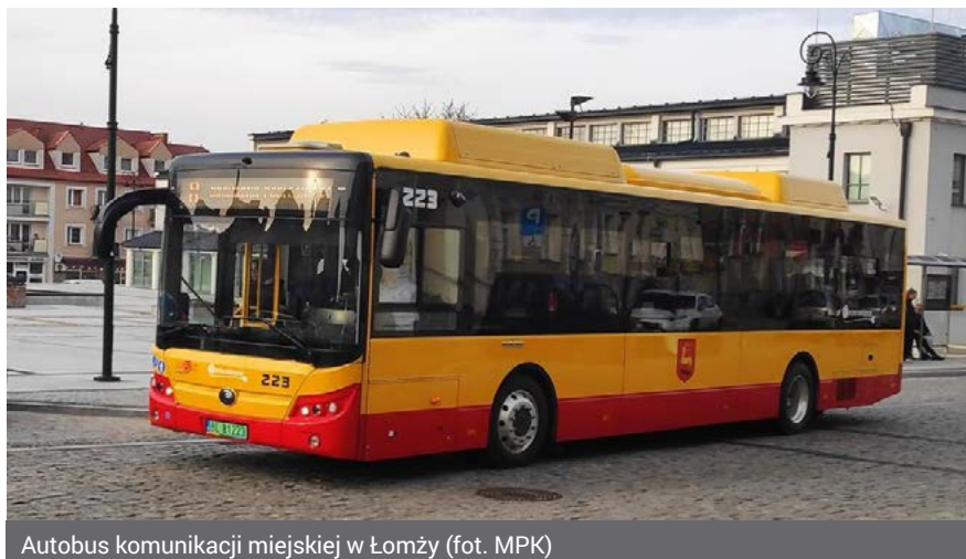
Autobus komunikacji miejskiej w Łomży