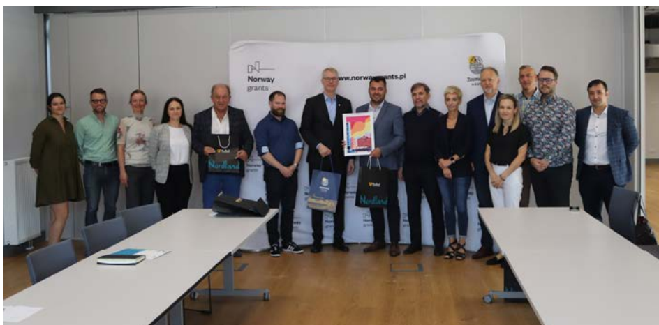
Spotkanie w Hali Kultury

W Zespole Szkół Weterynaryjnych i Ogólnokształcących nr 7 Norwegowie mieli okazję bezpośrednio zapoznać się z bogatą ofertą szkolnictwa zawodowego oraz bazą dydaktyczną placówki.