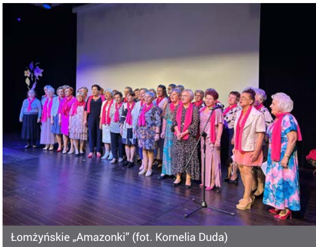
Łomżyńskie „Amazonki”

Wspierają się, pomagają innym chorym, ich rodzinom i mimo trudnych doświadczeń zachowują radość życia, której można im pozazdrościć. Łomżyńskie „Amazonki”, bo o nich mowa, obchodziły swój wielki jubileusz 30-lecia. Na zorganizowanej z tej okazji uroczystości w Hali Kultury nie zabrakło wspomnień, wzruszeń, życzeń, kwiatów i urodzinowych tortów, ale przede wszystkim uśmiechów i zapewnienia, że rak to nie wyrok, a profilaktyka może uratować życie.