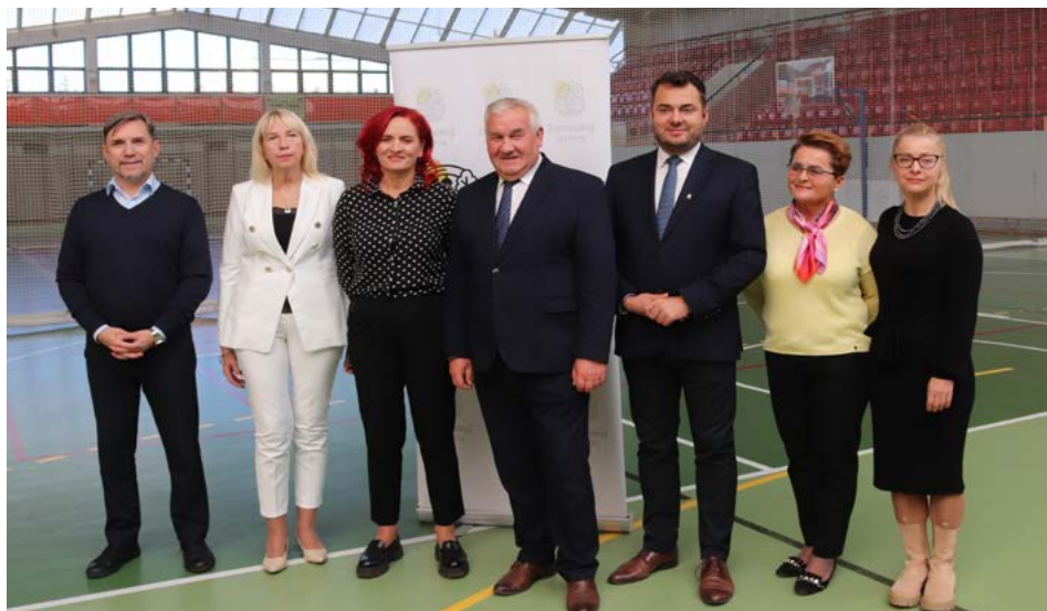
Uczestnicy briefingu prasowego, który odbył się w hali sportowej SP 9

Władze Łomży pozyskały kolejne wsparcie na realizację miejskich inwestycji z Rządowego Funduszu „Polski Ład”. Z obecnego naboru wniosków w ramach Programu Inwestycji Strategicznych nasze miasto otrzymało 30 mln zł na realizację zadania pn. „Modernizacja infrastruktury w mieście Łomża”.