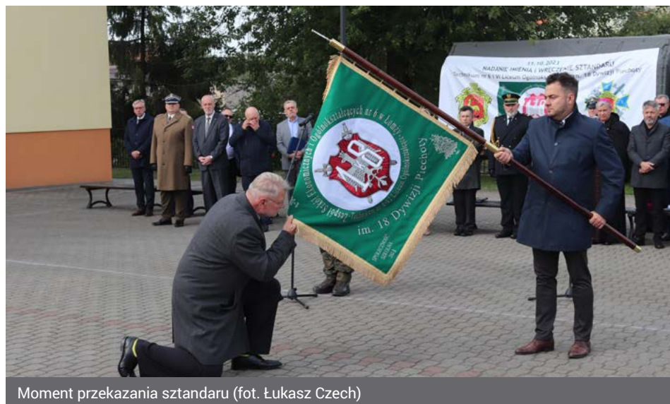
Moment przekazania sztandaru