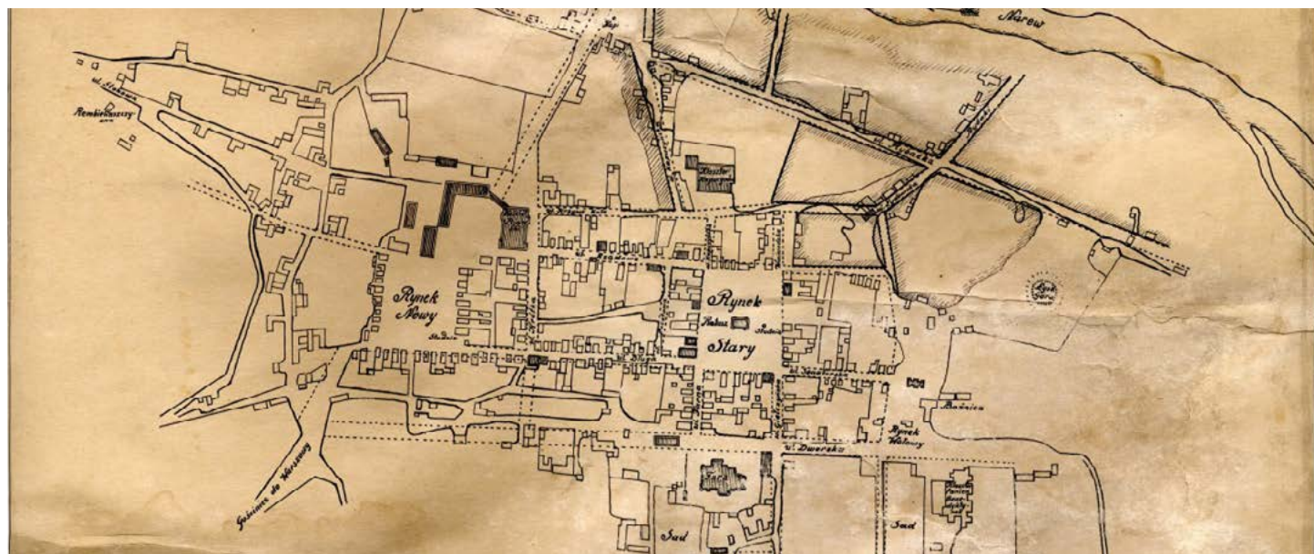
Wycinek mapy Łomży z 1805 r. (Archiwum Państwowe w Białymstoku Oddział w Łomży)