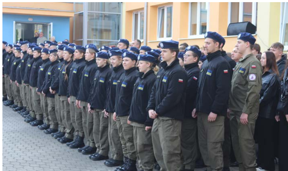
Uczniowie „Ekonomika”