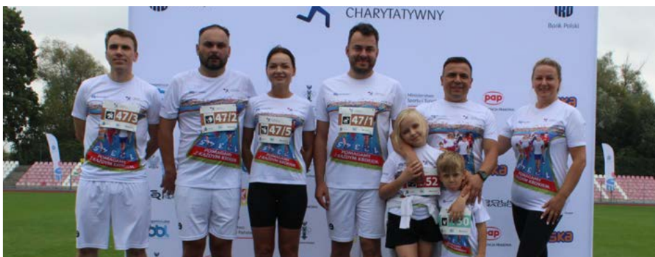
Drużyna Urzędu Miejskiego w Łomży spisała się na medal