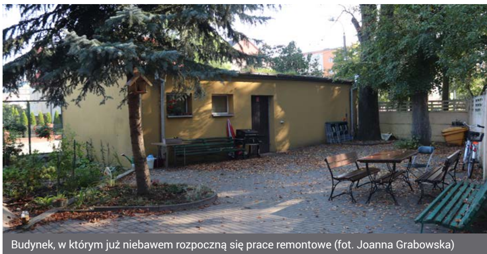
Budynek, w którym już niebawem rozpoczną się prace remontowe