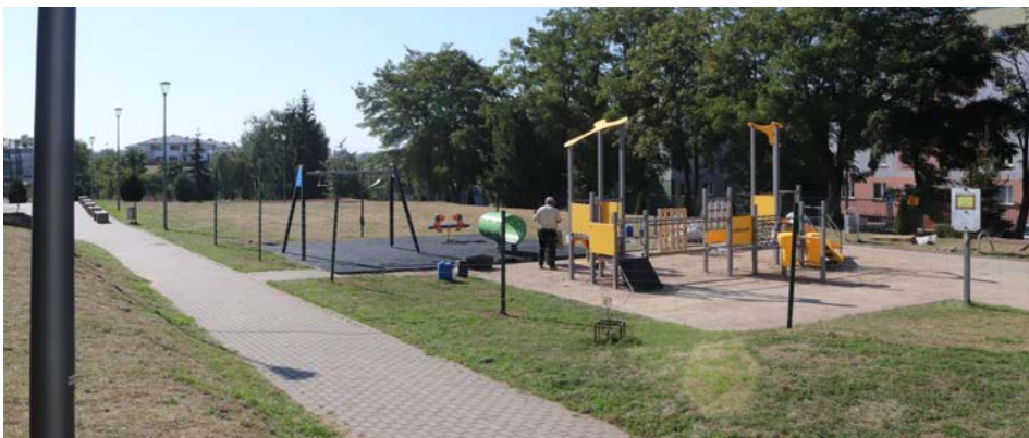
Prace remontowe na terenie placu zabaw dla uczniów 0-1