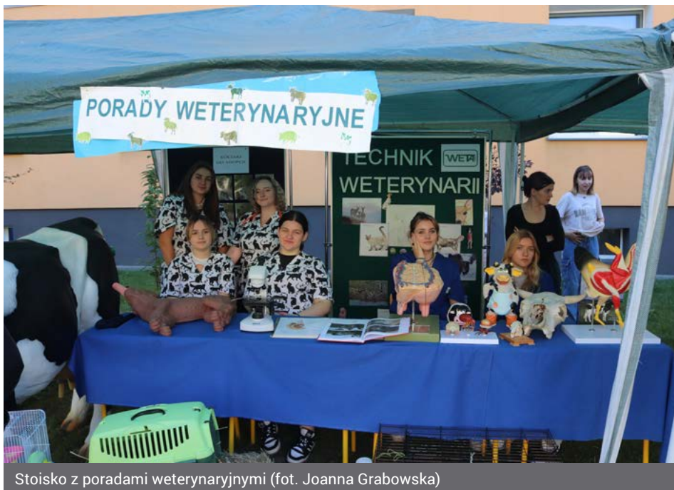
Stoisko z poradami weterynaryjnymi

W ramach 17. festynu „Pupile Wety” odbył się m.in. pokaz gołębi pocztowych, konkurs „Talenty Wety” i „Wybór Pupila 2023”. Nie zabrakło również stoisk ze zwierzętami, dmuchanych zjeżdżalni dla najmłodszych, porad weterynaryjnych, pokazów, eksperymentów naukowych oraz słodkiego poczęstunku i degustacji tradycyjnych potraw. Czas ułamy zwiędzającym atrakcje muzyczne z udziałem działających w szkole i zaproszonych zespołów.