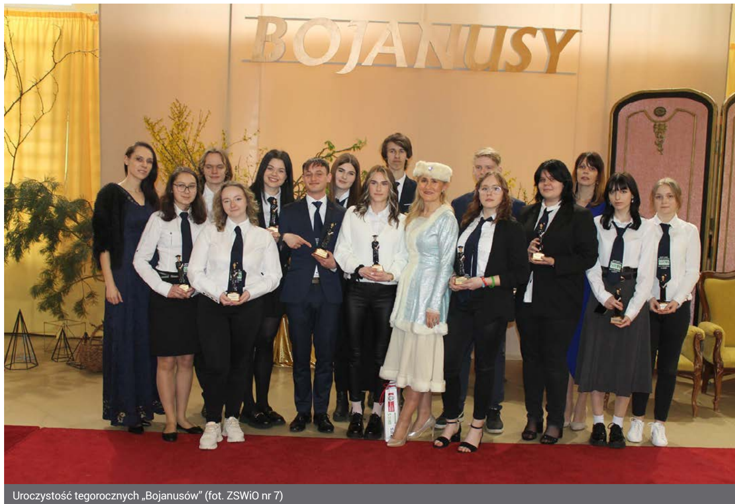
Uroczystość tegorocznych „Bojanusów”

społecznej. Był to bardzo ważny i ciekawy okres w moim życiu. Dzięki pracy radnej i wiceprzewodniczącej Rady Miejskiej udało mi się zrobić wiele dobrego dla mieszkańców naszej pięknej Łomży w dziedzinie rozwoju infrastruktury drogowej, edukacji, kultury i bezpieczeństwa. Doświadczenia samorządowca pomogły mi zbudować pozytywny klimat współpracy z nauczycie-