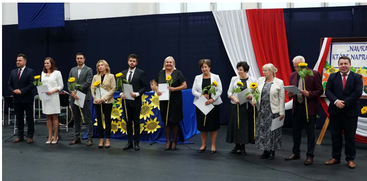
Pedagodzy, którzy otrzymali nagrody i wyróżnienia