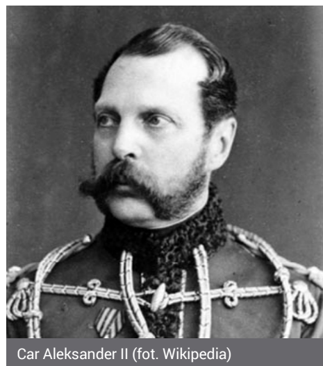
Car Aleksander II

stające w czasach carskich znaczenie Łomży, jako ważnego ośrodka gospodarczego i węzła komunikacyjnego, wymusiło potrzebę kilkukrotnej regulacji ulic w obrębie historycznego centrum Łomży. W ich wyniku w pierwszej połowie XIX w. przeprowadzono przekopem przez skarpe trakt wprost od Nowego Rynku, burząc przy tej okazji część zabudowań popijarskich pomiędzy kościołem i gimnazjum.