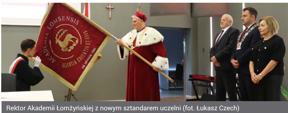
Rektor Akademii Łomżyńskiej z nowym sztandarem uczelni

- 20 lat istnienia to z historycznej perspektywy niewiele. Jeżeli jednak spojrzymy na to z punktu widzenia wartości, które stoją za uczelnią odkryjemy, że wpisują się one w ponad 600-letnią historię naszego miasta. Są wyrazem ambicji środowiska, naturalnej potrzeby czynienia z wiedzy użytecznego narzędzia do rozwoju – podkreślał rektor