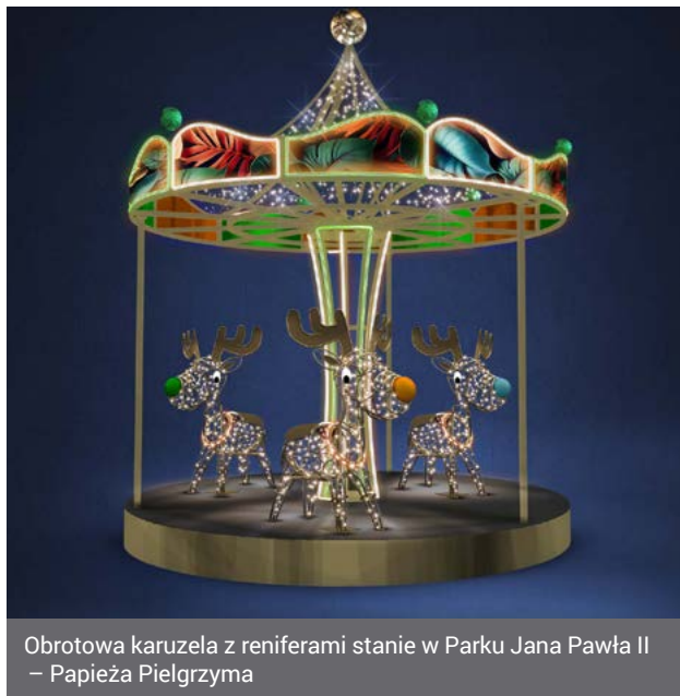
Obrotowa karuzela z reniferami stanie w Parku Jana Pawła II – Papieża Pielgrzyma

Nowe ozdoby pojawią się w naszym mieście już na Mikołajki. Od 6 grudnia oczy mieszkańców będą cieszyły także dobrze znane iluminacje, czyli kolorowa ciuchcia z wagonikami, piernikowy domek, motocykl świętego Mikołaja oraz świąteczne monidło, doskonałe do robienia pamiątkowych zdjęć. Nie zabraknie 3-metrowej wiewiórki świetlnej trzymającej orzech, czy dumnego 6-metrowego renifera. W parku będzie też dobrze znana, piękna fontanna świetlna oraz „śnieżna”, lukrowata brama. W głównym miejscu parku zostanie zlokalizowana 12-metrowa choinka rozświetlana przez 20 tys. punktów świetlnych, a w jej pobliżu przysiadzie znany i lubiany Miś Łomżatek, wygrywający kolędy i opowiadający bajki. Będzie także choinka w postaci eleganckiego stożka, a stylowe iluminacje pojawią się również na lampach oświetleniowych, także przy ważniejszych skrzyżowaniach i odcinkach głównych ulic.