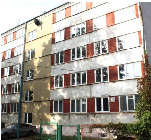
Budynek po dawnym hotelu robotniczym przy ul. Wesołej

W ostatnim naborze, w którym przyjmowanie wniosków trwało do 16 sierpnia, każda z jednostek samorządu terytorialnego mogła złożyć po trzy zadania, z czego jeden o wartości dofinansowania nie większej niż 2 mln zł, drugi 8 mln zł, a trzeci do 30 mln zł.