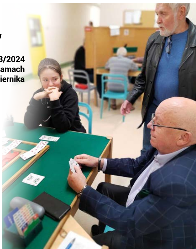
Łomżanie z ŁABS Dolina Narwi II w trakcie inauguracyjnych rozgrywek III ligi