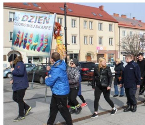
„Marsz Kolorowej Skarpetki”