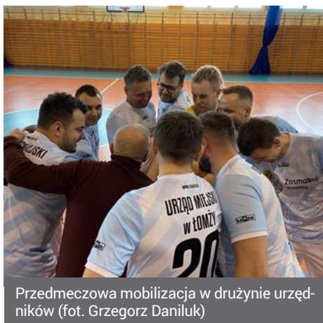
Przedmeczowa mobilizacja w drużynie urzędników

- Ten mecz to kolejna „cegielka” w budo-