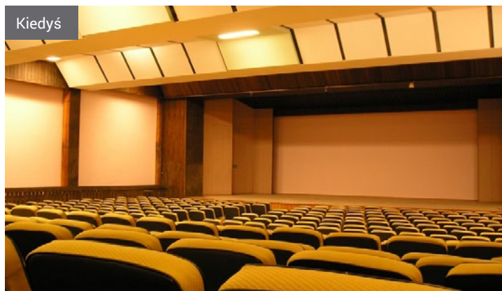
Filharmonia Kameralna