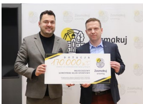
Z dotacją Młodzieżowy Łomżyński Klub Sportowy

- Otrzymane pieniądze przeznaczymy na szkolenie dzieci i młodzieży, zakup niezbędnego sprzętu, organizację turniejów tenisowych w różnych kategoriach wiekowych z naci-