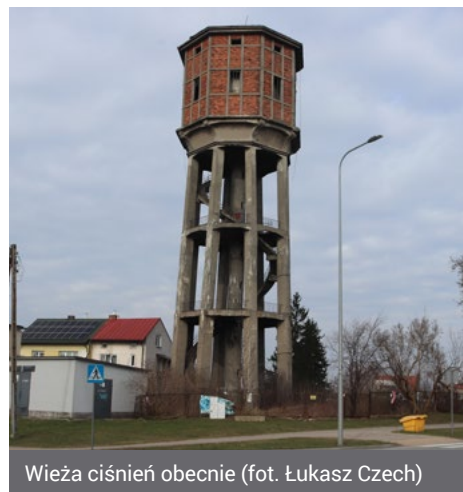
Wieża ciśnień obecnie

Plany władz miasta przewidują rozbudowę i przebudowę wieży ciśnień, w wyniku której powstaną m.in. punkt widokowy, gastronomia, sale warsztatowe, ekspozy-