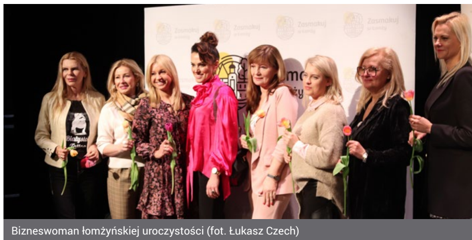
Bizneswoman łomżyńskiej uroczystości

Śniadania biznesowe pod hasłem „Biznes na obcasach” wpisały się w obchody Dnia Kobiet w naszym mieście. Są one w głównej mierze poświęcone przedsiębiorczym paniom, funkcjonującym z powodzeniem na terenie nie tylko naszego miasta, ale i regionu.