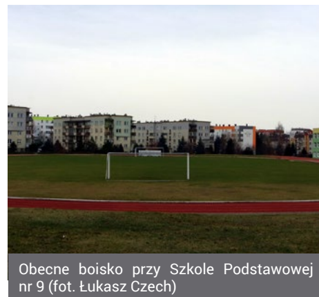
Obecne boisko przy Szkole Podstawowej nr 9

- Na marcową sesję skierowałem do Rady Miejskiej wniosek o zabezpieczenie kilkudziesięciu tysięcy złotych na opracowanie dokumentacji technicznej. Chcemy, aby obiekt był certyfikowany, miał nawierzchnię spełniającą wymogi FIFA, posiadał oświetlenie, drenaż i odrębne od szkoły pomieszczenia socjalne – przekazuje prezydent Mariusz Chrzanowski. Inwestycja miałaby uwzględnić po-