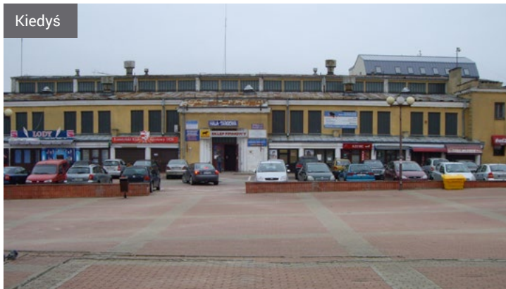
Hala Kultury