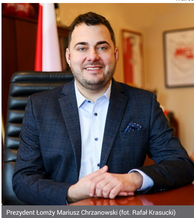
Prezydent Łomży Mariusz Chrzanowski

Kultura i edukacja są zapewne istotną przestrzenią do inwestowania. Są jednak też inwestycje w infrastrukturę. W tym okresie zrealizowano także ponad 50 przedsięwzięć, w ramach, których po-