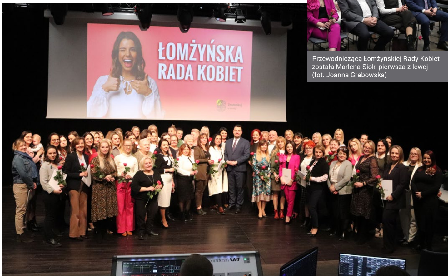
Członkowie rady podczas pierwszego posiedzenia