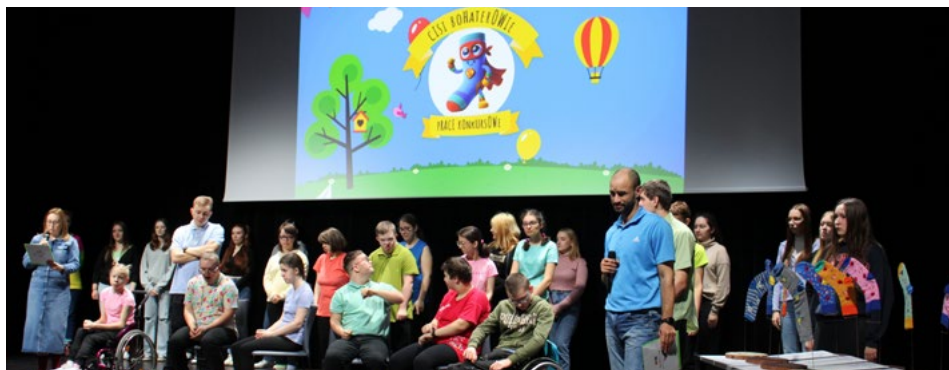
Uczestnicy konkursu plastycznego

Data 21 marca to nie tylko pierwszy dzień wiosny. Tego dnia obchodzony jest także Światowy Dzień Zespołu Downa. Jego celem jest podniesienie świadomości na temat życia i potrzeb osób z tą chorobą. Symbolem święta stały się kolorowe skarpetki, które miały również swój łomżyński akcent.