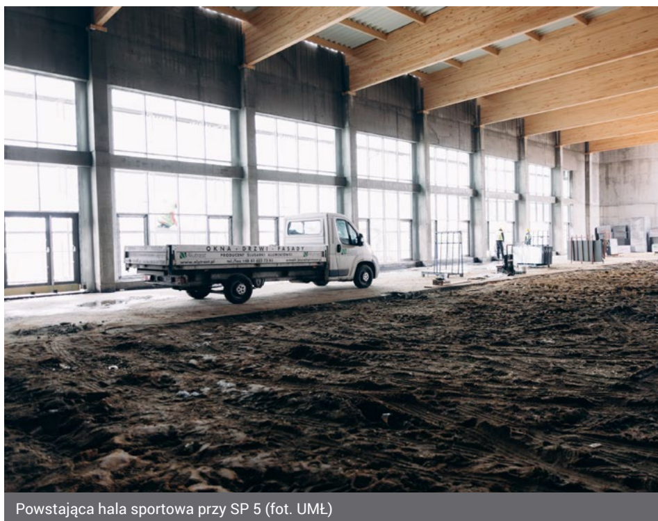
Powstająca hala sportowa przy SP 5 (fot. UMŁ)

uda się je zakończyć w przewidywanym terminie – mówi prezydent Łomży Mariusz Chrzanowski dodając, iż to jedna z ważniejszych w tym roku inwestycji, na którą Miasto Łomża pozyskało ogromne, bo blisko 10-milionowe dofinansowanie, a o kolejne 3 mln zł ubiega się z Funduszu Wsparcia Gmin i Powiatów.