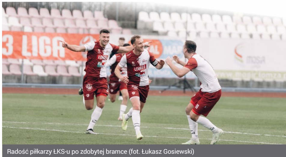
Radość piłkarzy ŁKS-u po zdobytej bramce