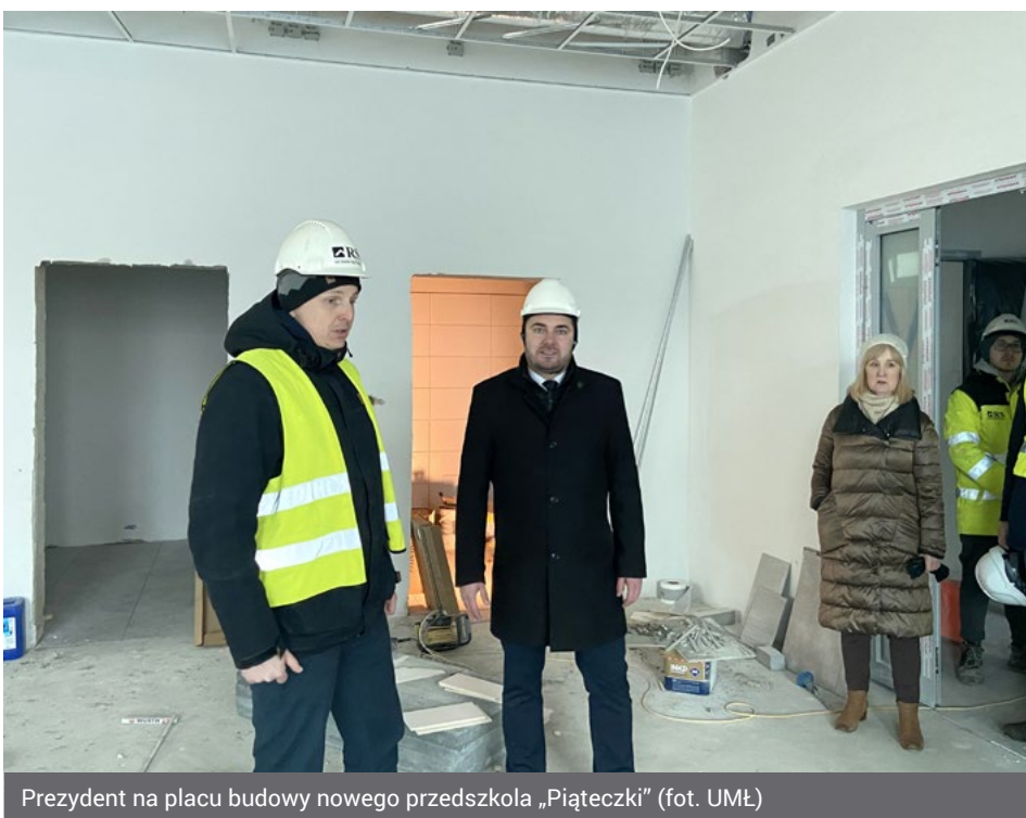
Prezydent na placu budowy nowego przedszkola „Piąteczki”