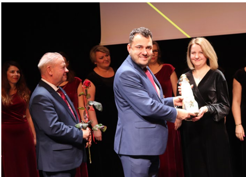
Nagrodę prezydenta Łomży w kategorii „twórczość artystyczna” otrzymał Chór Kameralny „Amici”