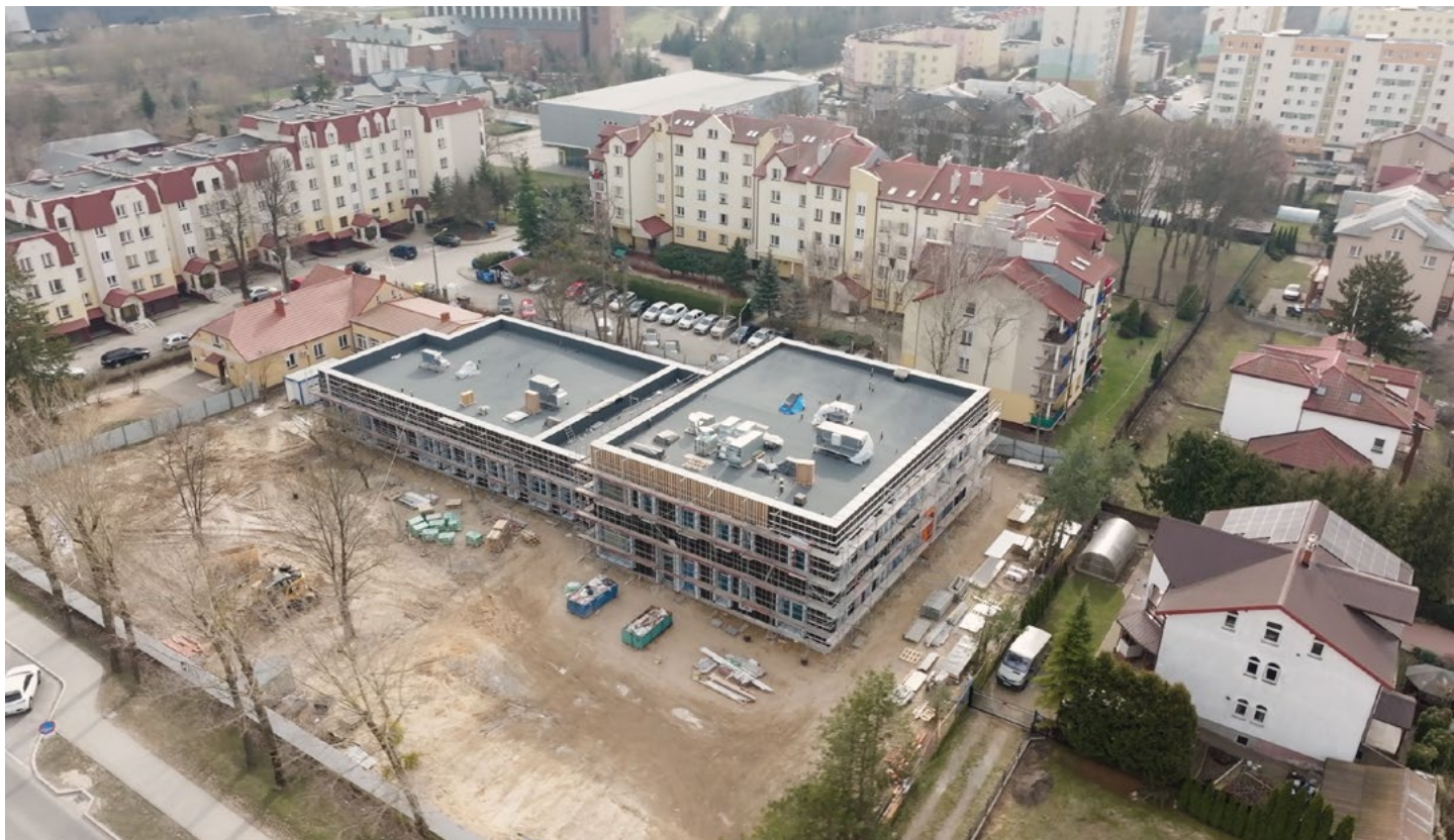
Budujące się Przedszkole Publiczne nr 5

Młode pokolenie to przyszłość Łomży, dlatego warto inwestować w oświatę. Wiele ze zrealizowanych w ostatnich latach przedsięwzięć dotyczyło szkół i przedszkoli, a będą kolejne.