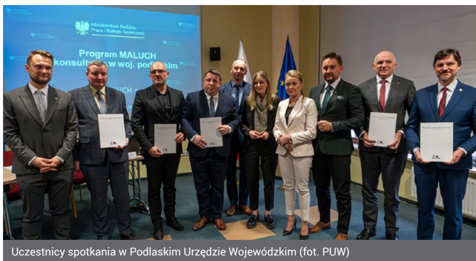
Uczestnicy spotkania w Podlaskim Urzędzie Wojewódzkim

Podczas wtorkowego spotkania w Podlaskim Urzędzie Wojewódzkim najaktywniejsze samorządy w programie „Maluch Plus” otrzymały z rąk wiceminister i wicewojewody podlaskiego, Pawła Krutula, podziękowania. W imieniu władz Miasta Łomża odebrał je zastępca prezydenta An-