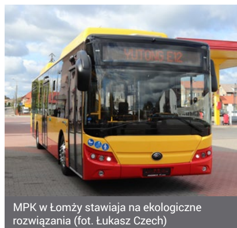
MPK w Łomży stawiają na ekologiczne rozwiązania

Podejmowane przez Miasto Łomża i MPK sp. z o.o. działania dostrzegalne są