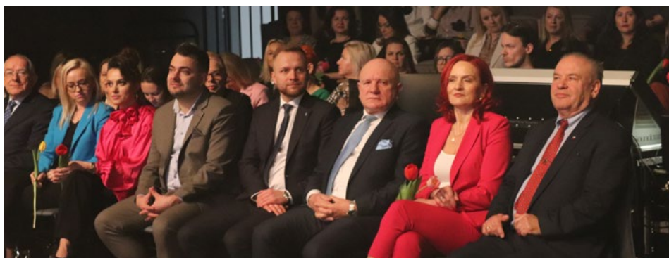
Uczestnicy marcowego „Biznesu na obcasach”