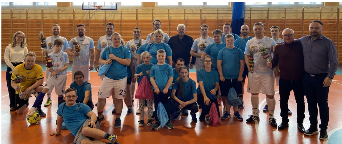
Pamiątkowe zdjęcie uczestników piłkarskiego pojedynku