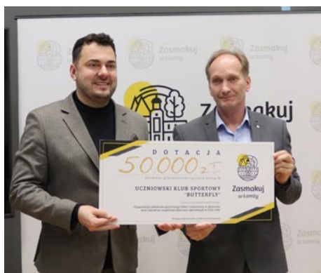
Dotację otrzymał Uczniowski Klub Sportowy „Butterfly”

skiem na turnieje „Tenis-10” czy na zgrupowania naszych sportowców – wylicza Tomasz Waldziński z Uczniowskiego Klubu Sportowego „Return” Łomża.