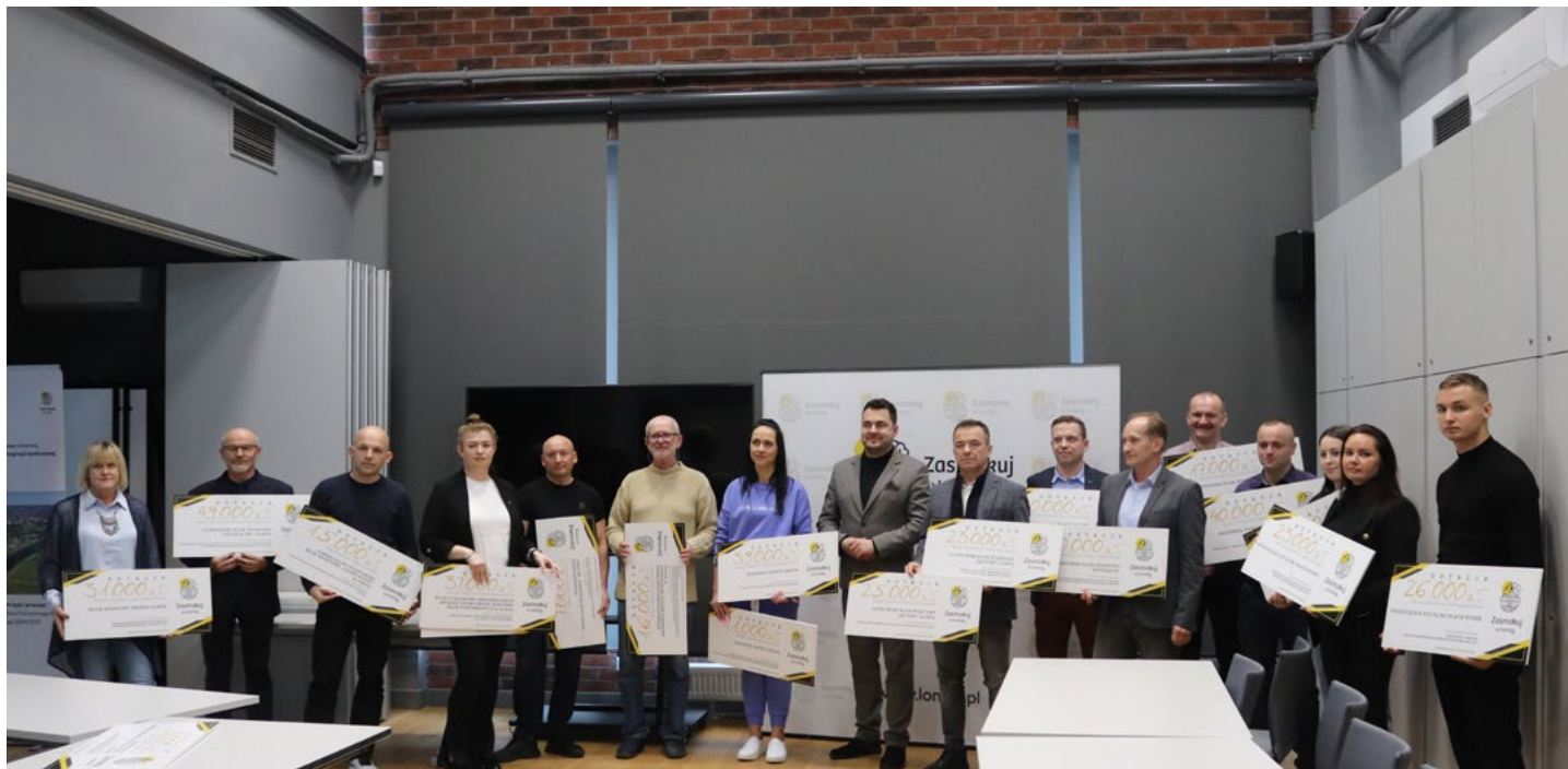
Uroczystość przekazania symbolicznych czeków