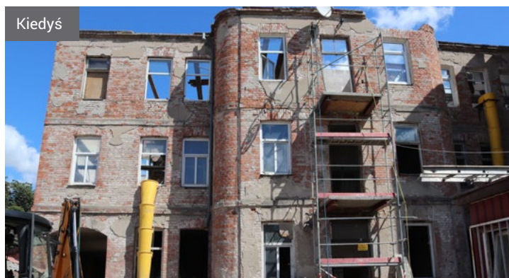
Kamienica przy ulicy Polowej 65