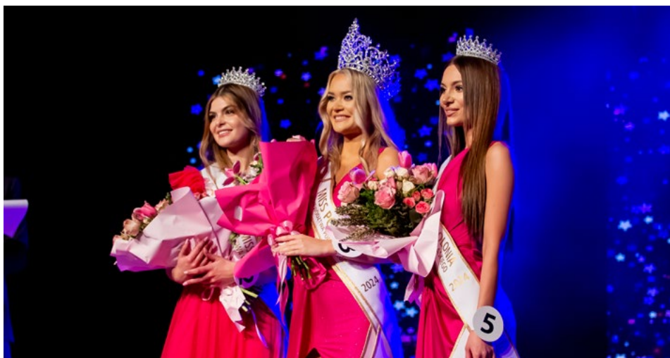
Laureatki Miss Polonia Województwa Podlaskiego

21-lątka ze Starych Kupisk k. Łomży została Miss Polonia Województwa Podlaskiego. Uroczysta gala odbyła się w Filharmonii Kameralnej w Łomży. O prestiżowy tytuł rywalizowało 20 kandydatek z całego regionu.