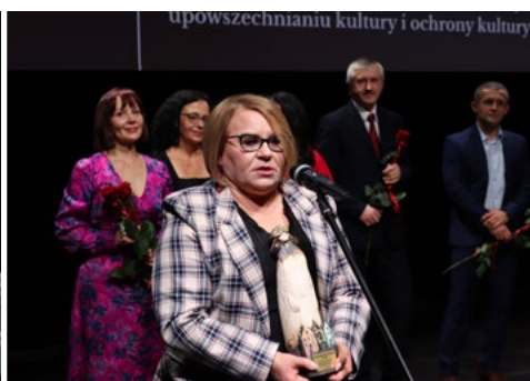
Nagrodę za upowszechnianie kultury otrzymała Miejska Biblioteka Publiczna