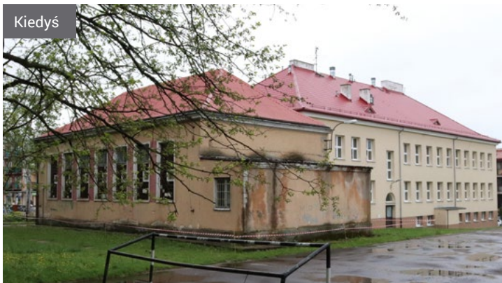
Sala gimnastyczna przy Szkole Podstawowej nr 2