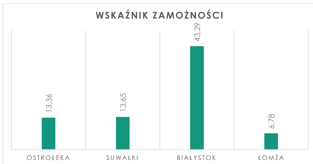
Wykres 1. Wskaźnik zamożności w wybranych miastach w roku 2012.